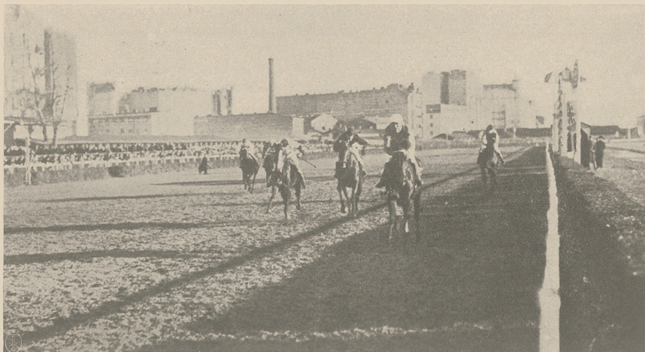
BEDUIN 2 l. og. (Albula — Mia May) Grona Ofic. 17-go p. Ułanów wygrywa pod żok. Fomienko Nagrodę 7.000 zł. — 1300 mtr. bijąc o 3 dług. Grzelę, Bacarata i 3 dalsze konie.

Nie wiem, czy taki fakt miał miejsce, czy też nie, czy były sankcje kompetentnych władz, — podaję jednakże taką możliwość dla przestrogi, — albowiem przykro jest widzieć, że tak szlachetne motywy, dobre chęci i praca (dochód był przeznaczony na dobry cel), mogą iść na marne w powodu braku zdyscyplinowania społeczeństwa.