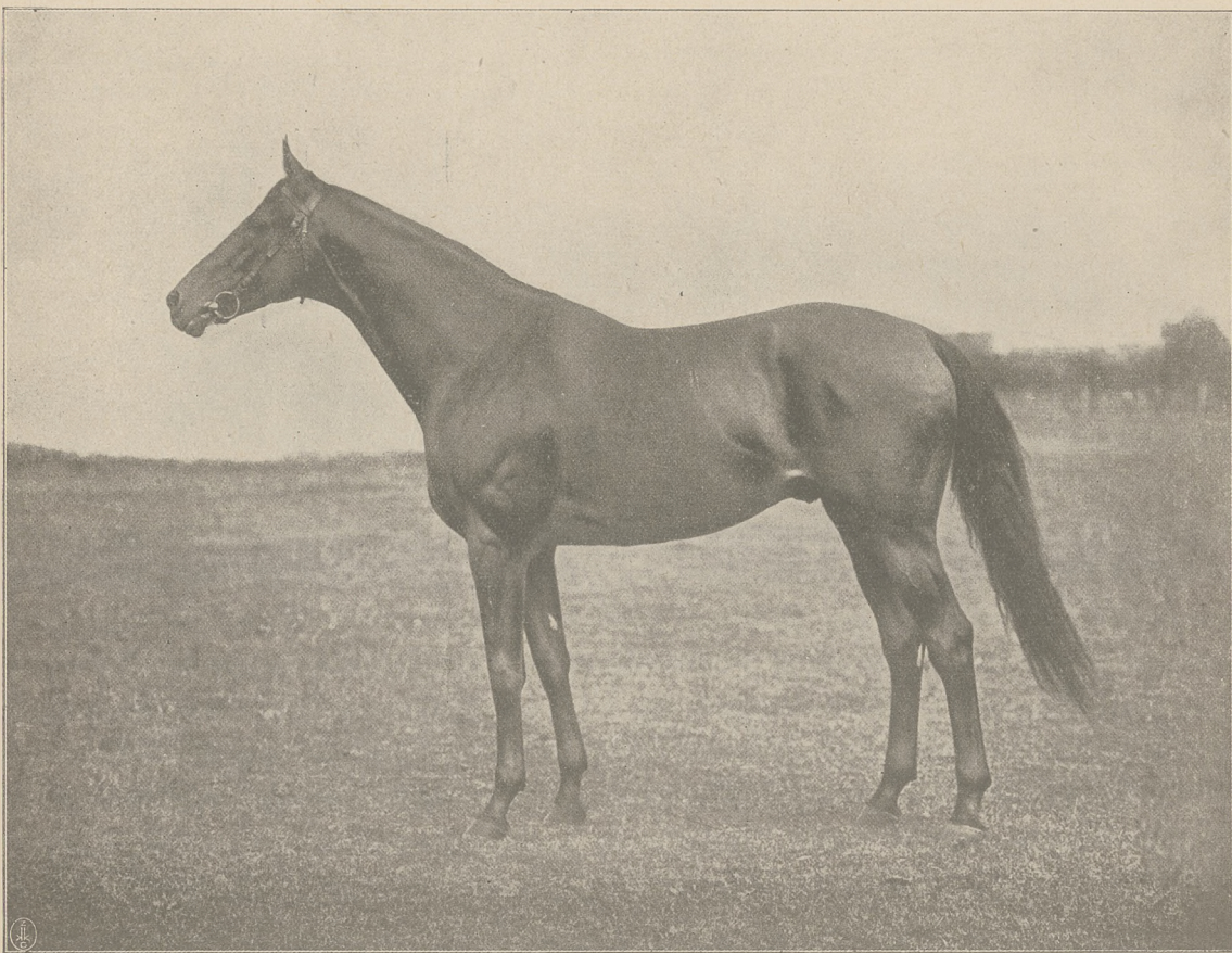
GANELON og. gn. ur. w 1920 r. (Pergolese — Grave and Gay po Henry of Navarre) wybitny reproduktor niemiecki, własność pp. A. i C. Weinberg.

Wskaźnik staminy dla jego potomstwa w Anglii za rok 1928 jest 8.54 furlongów, czyli że 1716 metrów jest dla jego dzieci najodpowiedniejszym dystansem, zato ze strony matki The Cheetah ma prądy stayer'ów: Hamp-