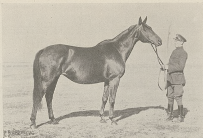
Klacz A. B. C. (Irrlehrer—Adelaide po Y. Barometer—Le Butard xx —The Prince xx) ur. w Beberbeck 1923 r. sk. gn. 158 cm. rodz. 15.

Od Orsowy wywodzą się następujące matki: