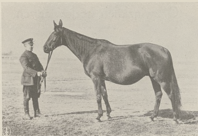
Klacz OTHERO (Baltinglass xx—Olli po Jubelgreis—Blondel—Dandin xx), ur. w Beberbeck 1920 r. gn. 160 cm. rodz. 8.

Z tej linii pochodzi cenny ogier Mechanikus (St. Tropez xx — Mechthild po Blondel ), ogier czołowy w Gra-