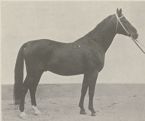
351'SCHAGYA (Schagya X—110 Amurath) ogier czołowy Państw. Stadniny Koni w Racocie.

Poszczególne produkty tych krzyżowań oparte na inbredzie na Amuratha, wzmocnione inbredami na rody Schagya i Gidran, względnie znane konie pełnej krwi, będą łączone między sobą, co pozwoli na zrównoważenie i skonsolidowanie rodowodów i prawdopodobnie da w wyniku