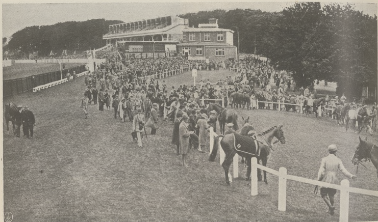
GOODWOOD (Anglja): Na paddocku przed rozgrywką Stewards Cup.

Przebieg wyścigu był następujący: leadery Centaur, Bohun, West Nor West prowadzą, za nimi podąża Herku-