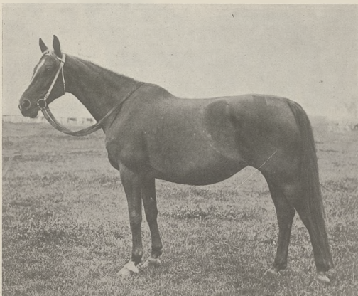
NUROZA, hanow. (Nordland — Nikäs) klacz stadna Państw. Stadniny Koni w Racocie. (Do art. p. J. Grabowskiego).

Ciekawem jest, iż wszyscy potomkowie Herod'a byli z czysto francuskich, względnie mało znanych w Europie