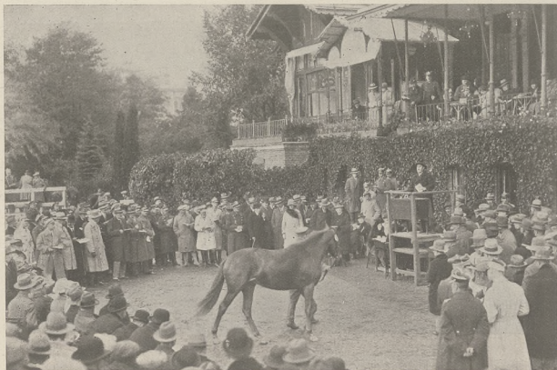
Z tegorocznej Wielkiej Dorocznej Licytacji w Warszawie.

W gonitwie pętowej Vipida i Armagnac stanowiły czoło stawki, na przeciwległej prostej Gozdawa przecho-