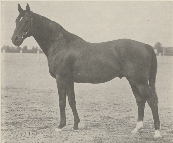
KING'S IDLER og. gn. ur. w 1916 r. (Lomond — In Sight po Winkfield) państwowy reproduktor. Ojciec Fausta, Farmazona, Hory, Guzohana i t. d. W ub. roku potomstwo jego wygrało 269.998 złotych.

TREŚĆ Nr. 44: Z tygodnia. — Kupno ogierów pół krwi, przeznaczonych na reproduktory, Chodowiecki, mjr. — Kronika krajowa, zagraniczna i Rezultaty wyścigów konnych w Warszawie.