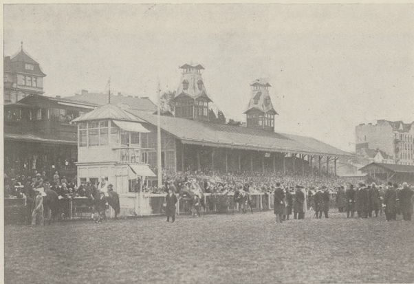
Parada uczestników przed Wielką Nagrodą Warszawską (75.000 zł. — 2800 mtr.).

W pozagrupowej gonitwie dnia, na krótkim dystansie 1300 mtr. przyjęły uczestnictwo: Forward, Farmazon, Dobra Wróżka i Globtrotter. Dobra Wróżka, Globtrotter, Forward idą grupą, na prostej Farmazon mija kolejno uczestników, dochodzi wreszcie do prowadzącego Globtrottera i po krótkiej, lecz mocnej walce bije go o krótki łeb; o kilka długości z tyłu Dobra Wróżka, za nią Forward, który opadł na prostej.