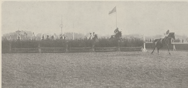
Ploty. Handicap 7.000 zł. — 3200 mtr.

Co do koni, to były one sprowadzane z Anglii, Francji, Belgii, Danji i Holandji, przeważnie robocze, odpowiednio do uprawy roli, karczunków, transportu materiałów na różne budynki, osady i t. p. Byłoby jednak mylnym mniemanie, iż konie z Europy tylko robocze lub pociągowe przybywały. Przeciwnie napływowe nowe warstwy osadników składały się z ludzi różnego pokroju, zamożności, zamiłowania.