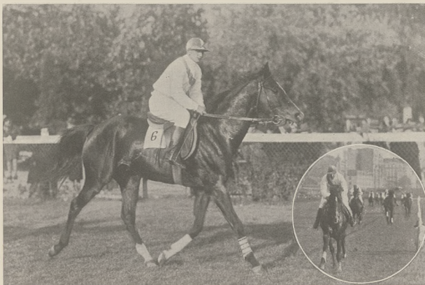
MORGAT B. W. pln. og. c.-gn. (Morganatic — Topola) p. T. Falewicza, jeden z najlepszych naszych plotowców (j. Ustinow).

Ryzyko dla spółki jest także samo, jak wogóle w hodowli, lecz przy braku epidemii, a przy umiejętnym prowadzeniu zapewnione jest zupełnie dobre oprocentowanie włożonego kapitału. Poza to, udana taka impreza bezsprzecznie wywarłaby z latami ogromnie dodatni wpływ