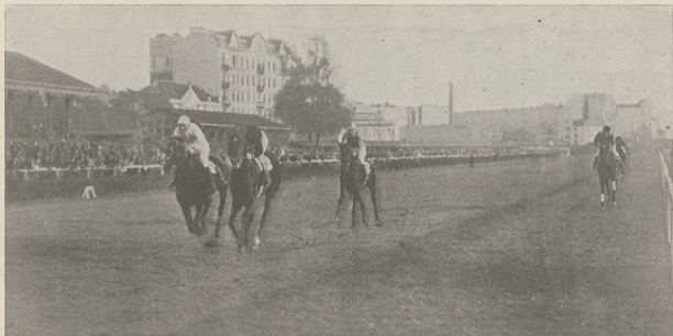
OSOBA Z INTELIGENCJI 3 l. kl. kaszt. (Fils du Vent — Pergettyü) M. i T. Babeckich wygrywa pod ż. Góreckim nagr. wartości 4.000 zł.—2200 mtr., bijąc łatwo o 3/4 dl. Forwarda, Burlaja, Fagasa i Irydjona.

Dwie gonitwy wygrały konie stada E. Grzybowskiego: Lopek i Korynna, dwie stada „Bartoszkówka”: Dri Dri i Dyana, oba te konie pochodzą od jednej klaczy: Lanoline; po Mantonie wygrał Harpagon i Dri Dri, po Harrier — Dyana i Lalita Liana. Tor, po długotrwałych deszczach pozostał ciężki.