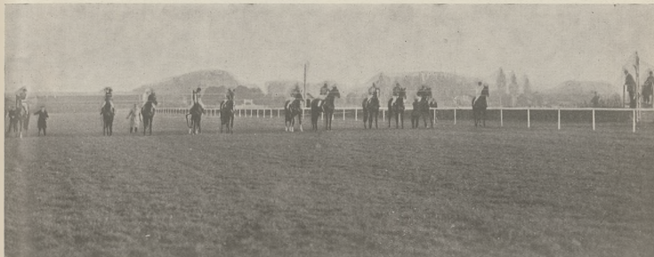
Start w Nagrodzie im. L. J. hr. Krasińskiego (20.000 zł. — 2200 mtr.); stoją od prawej strony: Bimbus, Osoba z Inteligencji, Furf, Ibanez, Chevrefeuille, West Nor West, Mindowe, Grzela, Forward, Konsul i Derkacz.

Pozostałe gonitwy grupowe: córka Balthazara i Crescentic, Czataldza, doszła naprzeciwko trybun głównych do przodującej Farandoli, pociągając za sobą Gerezę, którą pobiła o 3 długości, a dalej Farandolę i pozostałych uczestników. Do prowadzącej Fanfary doszedł na prostej Impas, bijąc ją łatwo o 3 długości, następnie zaś finishującą Betinę i Basię II.