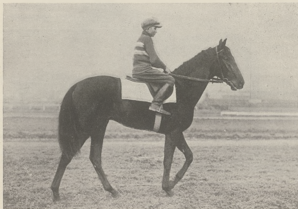
BEDUIN II, 2 l. og. gn. (Parsifal—Berceuse) st. „Ktery—Szepietów”, wielce obiecujący szermierz w gonitwach przyszłego roku.

Należy przypuszczać, że łączenie ze sobą osobników genotypowo jednakowych, podług powyższej zasady, jest oparte na pewnych, jeszcze niezbadanych, przymiotach krwi, które należy przypuszczać dałyby się zbadać bliżej