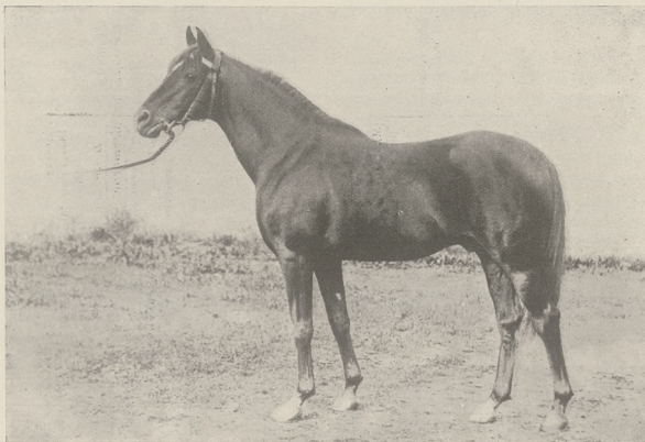
NIBEH og. kaszt., ur. w 1906 r., rasy Azil, wychowany przez szczep Fed'an-Anaze, importowany do Francji w 1912 r. Ojciec import. do stada Romana ks. Sanguszkii. kl. Arba i czołowego og. Nedjari.

dużej wagi tablic genealogicznych, bez których pokrewieństwo tych „Superstallionów” nie dałoby się drogą zwykłego rodowodu stwierdzić, gdyż w VIII-m pokoleniu rodowodu otrzymujemy 256 koni, w których bez tablic rozemniezić się byłoby bardzo trudno, następnie zaś nasuwa przypuszczenie, że z punktu widzenia hipologicznego należy linię tę wzmocnić, łącząc ze sobą w rodowodach nazwiska tak wybitnych koni, jak The Tetrarch, Prunus, Teddy, Diophon i Gainsborough, opierając się na zasadzie, że skoro Langar Mare wykazała tak silną żywotność, by w ósmym pokoleniu wydać na świat szereg koni tej miary,