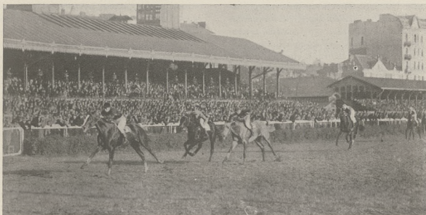
ECLAIR, 2 l. og. kaszt. (Bafur—Bay Leaf), K. hr. Zamoyskiego i p. M. Radwana wygrywa Nagrodę im. J. Reszkego (10.000 zł. — 1300 m.), bijąc pod żok. Magdalińskim pewnie o 1/2 długości Isarda III, Hermesa II, Duca i Harmonję II.

Ojciec jego i matka idą z krwi Bend Or'a. Podajemy w skróceniu rodowód tego ogierka przypuszczając, iż może on zainteresować naszych czytelników, a dla wielu może być nieznanym.