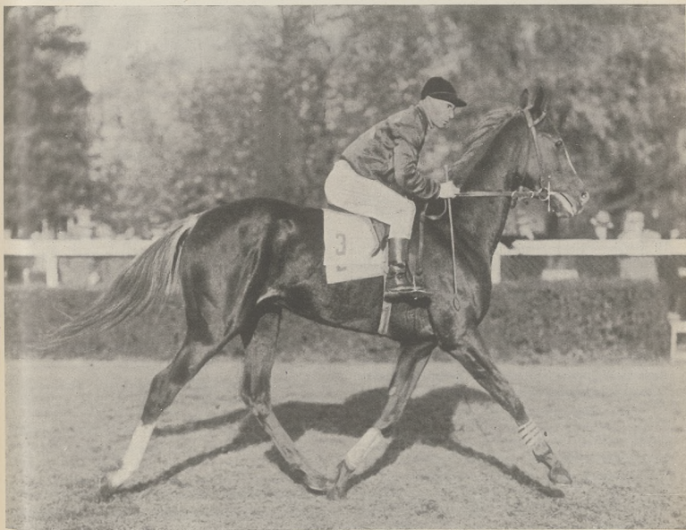
ECLAIR, og. kaszt. ur. w 1928 r. (Bafur—Bay Leaf po Cylgad) K. hr. Zamoyskiego i p. M. Radwana, zwycięzca nagrody im. J. Reszkego (10.000 zł. — 1900 m.) pod żok. Magdalińskim; w r. b. biegał 7 razy i wygrał 6 wyścigów, a 1 raz zajął trzecie miejsce.

TREŚĆ Nr. 48: Bilans sportowo-hodowlany 1930 roku. Dwulatki (Ciąg dalszy). — Studja hodowlane w świetle genetyki krzyżowań, J. U. Niemcewicz. — Kronika krajowa i zagraniczna.