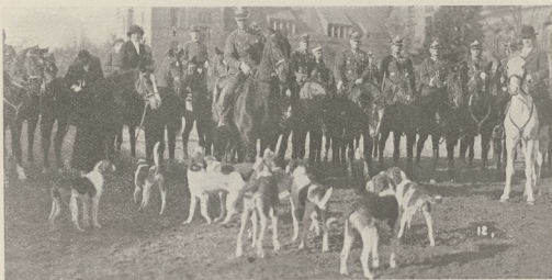
Z biegu par-force 17 pułku Ułanów Wilkp. w Lesznie w dniu Św. Huberta.

W międzyczasie jednak rozwijała się (i rozwija się dzisiaj jeszcze) znakomicie linja ta w krajach, które importowały do siebie konie z krwi St. Simon'a, a więc we Francji, w Niemczech, we Włoszech, w Austrii, w Polsce,