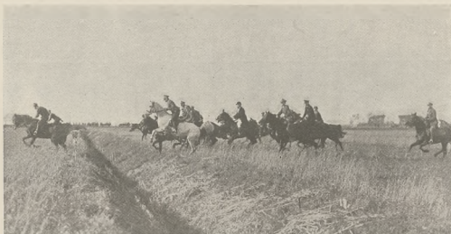
Z biegu par-force 17 pułku Ułanów Włkp. w Lesznie w dniu Św. Huberta.

Z tych przedstawicieli potężnej krwi Bend'Or'a zajmuje Phalaris dopiero 4-te miejsce na liście zwyciężskich reproduktorów, Grand Parade — 5-te, Beresford — 6-te,