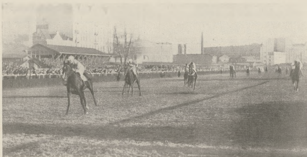
HARPAGON, 4 l. og. gn. (Manton — Habe) A. hr. Morstina wygrywa pod żok. Fomienko (55 kg.) Cesarewitech Hdcp. (15.000 zł. — 3621 mtr.) bijąc łatwo o 4 dług. Figaro, Herkulesa, Fenomena, Zbira i 9 dalszych koni.

Ormonde (Flying Fox), Bona Vista (Cyllene), Kendal (Fervor i Tredennis), oraz Mantagon (Wool Winder), jak również szereg dobrych ogierów: Locarno, Rapallo (U. S. A.), Laveno, Orelia, Orvieta, Rouge Dragon i Orwell. Wszystkie te konie są synami Bend' Or'a, z matek po Macaroni, jak również siostra Ormonde'a, Ornament, która dała Sceptre i stworzyła wybitną linję żeńską, z której się wywodzą konie tej miary, co Buchan, Craig an Eran, Saltash i Sunny Jane.