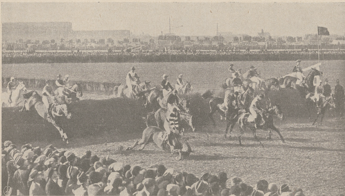
Z tegorocznego Grand National Steeplechase w Liverpoolu. Pole złożone z 36 koni skacze pierwszy płot.

Przygotowanie koni zawdzięczamy łagodnej tegorocznej zimie (zaledwie dwa tygodnie przymrozków w lutym), co się tyczy zaś marca, to równie słonecznego nie pamiętają najstarsi ludzie.