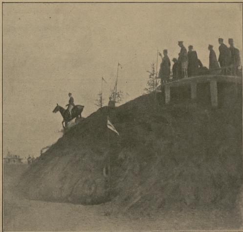
Konkursy hipiczne 1 p szwależerów im. Józefa Piłsudskiego 6 maja 1922 r. (fot. własn. „Jeźdźc. i Hod.”).

Podobnie: 1. Ballaghtobin, 2. Persim- mon, Diamond Jubilee i Flori- zel III, 3. St. Denis, 4. Saltpetre.