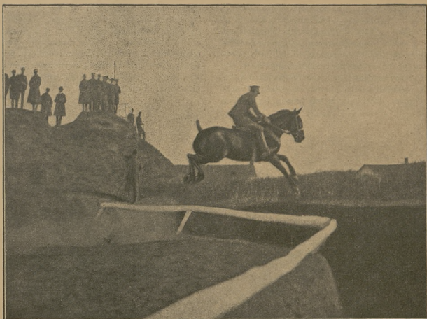
Konkury hippiczne 1 p. szwoleżerów im. Józefa Piłsudskiego 6 maja 1922 r. (fot. własn. „Jeźdź. i Hod.“).