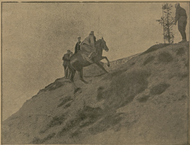
Konkury hippiczne 1 p. szwoleżerów im. Józefa Piłsudskiego 6 maja 1922 r. (fot. własn. „Jeźdź. i Hod.“).