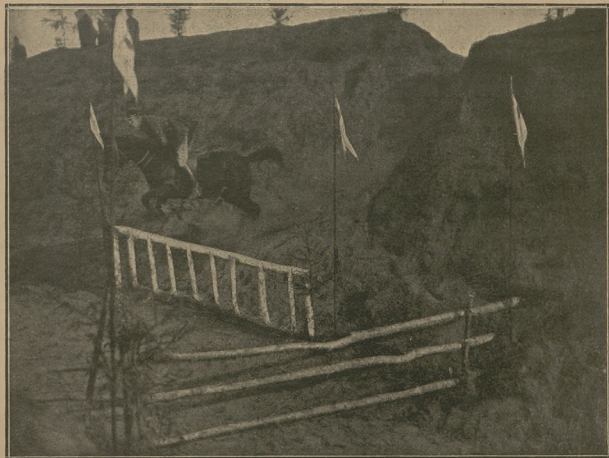
Konkursy hipiczne 1 p. szwalcierów im. Józefa Piłsudskiego 6 maja 1922 r. (fot. własn. „Jeźd. i Hod.”).

wyrobiony rzut oka, co do rozmiaru przeszkody, umie doprowadzić do niej konia, pobudzić do skoku, podtrzymać przy gruntowaniu, a zarazem silnie siedzi w siodle — ma