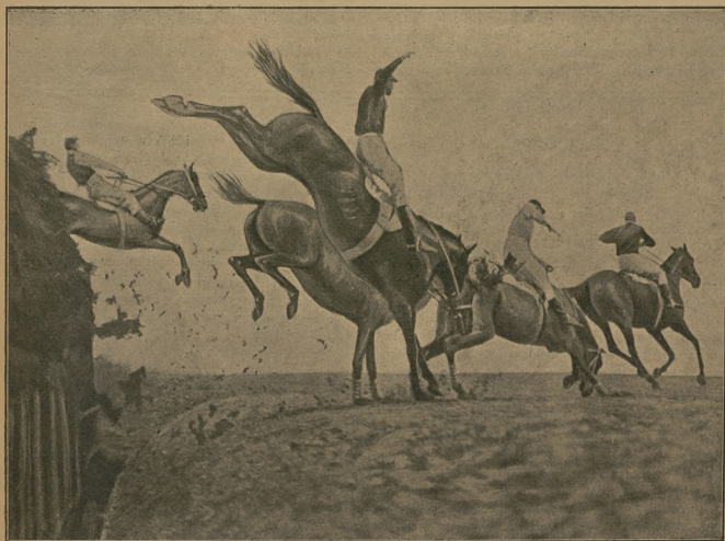
Fragment z Liverpoolskiego Steeple Chase'u z r. b. Skok przez Becher's Brook.

ADRES REDAKCJI I ADMINISTRACJI Warszawa, Hotel Europejski Nr. 106.