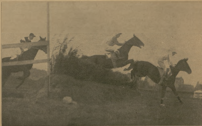
CYCLADE, IDOMOS, LEONARDO w akoku przez przeszkodę.