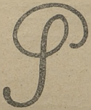
Fig. 9. Piętno pomorskiej księgi stadnej.

Na Pomorzu niemieckim używane jest piętno pomorskiej Księgi Stadnej (fig. 9), co wyobraża połączone litery P. i S. Znak ten tem się odznacza, że nie posiada korony państwowej.