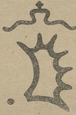
Fig. 2. Piętno kontrolne pow. Gumbinnen.