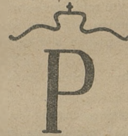
Fig. 11. Poznańskie piętno kontrolne.

Dużo jest oczywiście w tem zdaniu zarozumiałości co do wartości konia wschodnio-pruskiego, jeśli chodzi wszakże