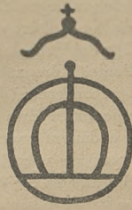
Fig. 8. Piętno kontrolne pow. Królewicze Allenstein.

dowodem ustalonego pochodzenia i wynikającej z tego większej wartości zwierzęcia