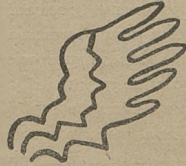
Fig. 10. Piętno poznańskiej księgi stadnej.