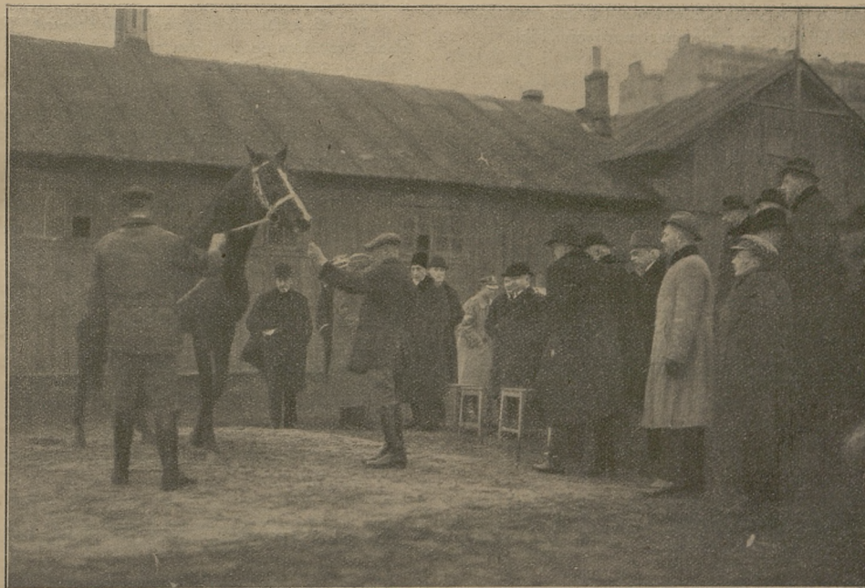
Ogledziny ogierów-reproduktorów zakupionych w Anglii dla Zarządu Stadnin Państwowych.

Z powodu stale wzrastających kosztów wydawnictwa — uprzejmie prosimy o niezaleganie w prenumeracie i wnoszenie jej przekazami pocztowymi.