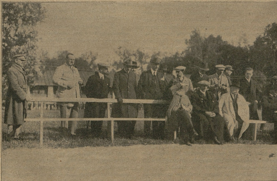
Misja francuska rolnicza w Janowie.