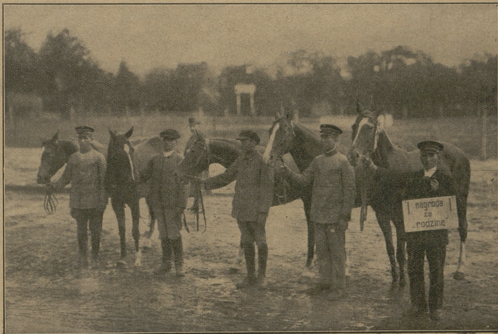
Rodzina kl. „Egida” nagrodzona złotym medalem na Wystawie Rolniczej w Poznaniu.

Warszawa, Krakowskie Przedmieście 32, telef. Nr. 220-25. Rachunek P. K. O. Nr. 6161.