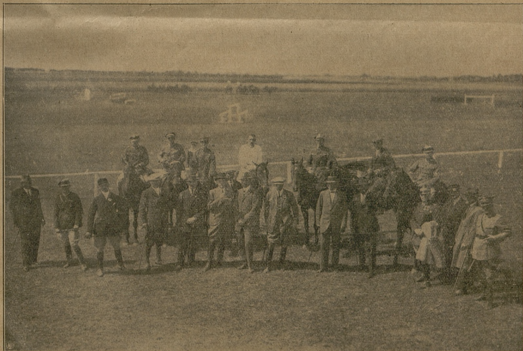
Uczestnicy championatu konia wierzchowego w Piotrkowie wraz z gronem sportsmanów, członków Tow. Piotrkowskiego.

Warszawa, Krakowskie Przedmieście 32, telef. Nr. 220-25. Rachunek P. K. O. Nr. 6161.