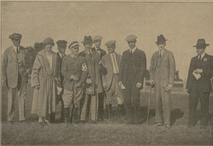
Grupa sportsmanów na wyścigach w Piotrkowie.

Wyścigi i konkursy szły składowo i punktualnie, co trzeba zaznaczyć, gdyż przy prowizorycznych urządzeniach nie mało to wymagało pracy i wysiłków członków Zarządu: