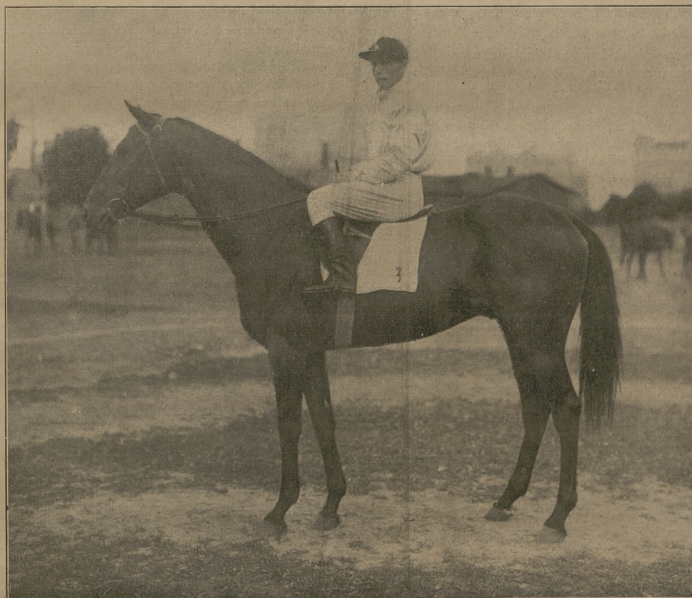
ARMENIER 7 l. og. gn. (Dark Ronald i Abwechslung), zwycięzca nagr. Sac à Papier.