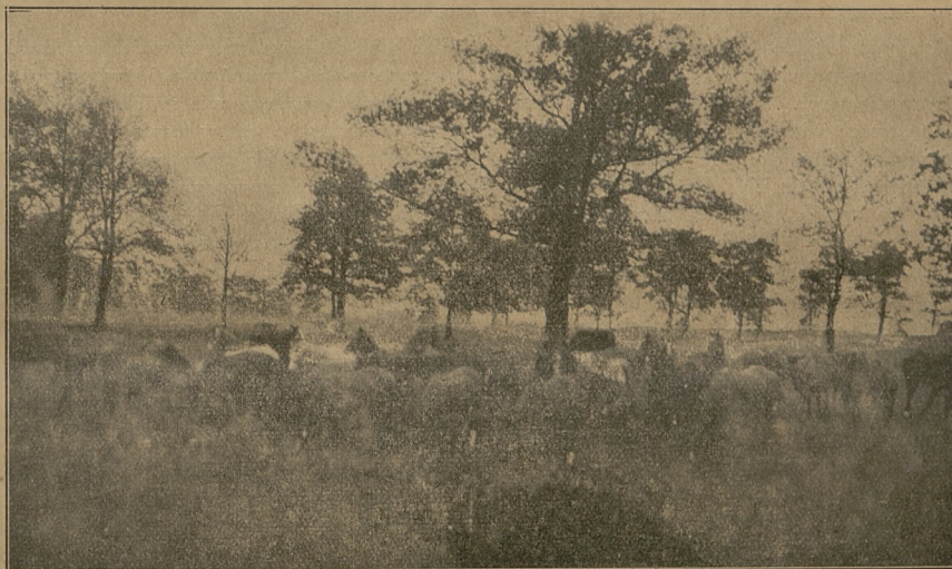
Na paddocku w Janowie Podlaskim (fot. wł. „Jeźdźc. i Hod.”).