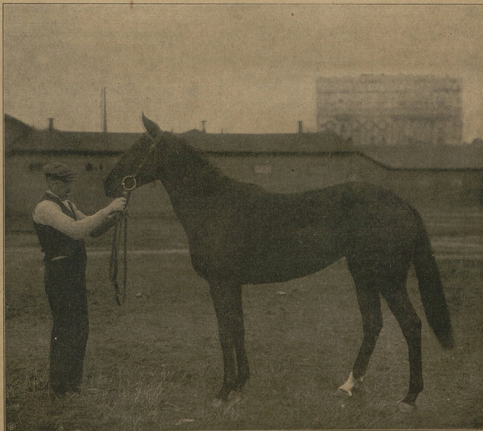
CYLICJA kl. gn. po Fils du Vent i Francja, ur. w r. 1921 w Państwowej Stadninie Janczewskiej. Zwycięzczyni nagrody Borowna (fal. wł. „Jeźdź i Hod.”).