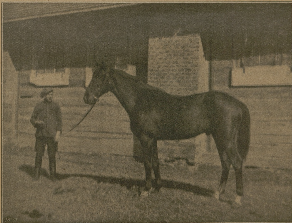
WILY ATTORNEY og. kaszt. (Tredennis i Bachelor's Berill), urodz. w 1917 r. w Anglii.