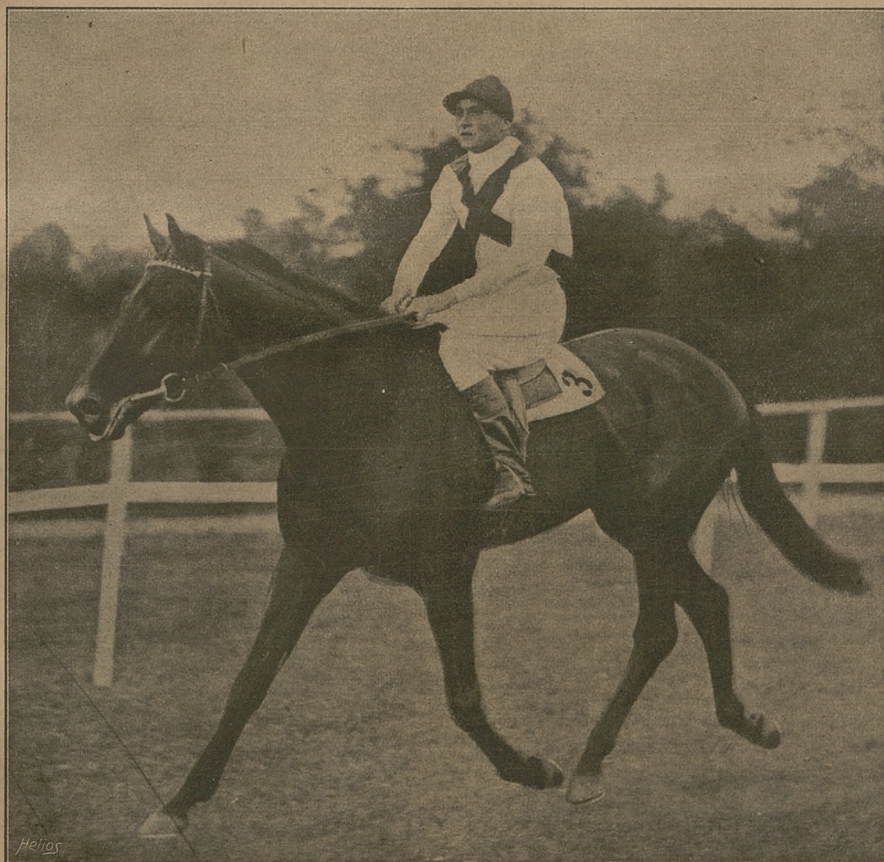
SCOPAS 41. og. gn. po Sunstar i Spring Chicken, najlepszy starszy koń włoski.

Warszawa, Krakowskie Przedmieście 32, telef. Nr. 220-25. Rachunek P. K. O. Nr. 6161.