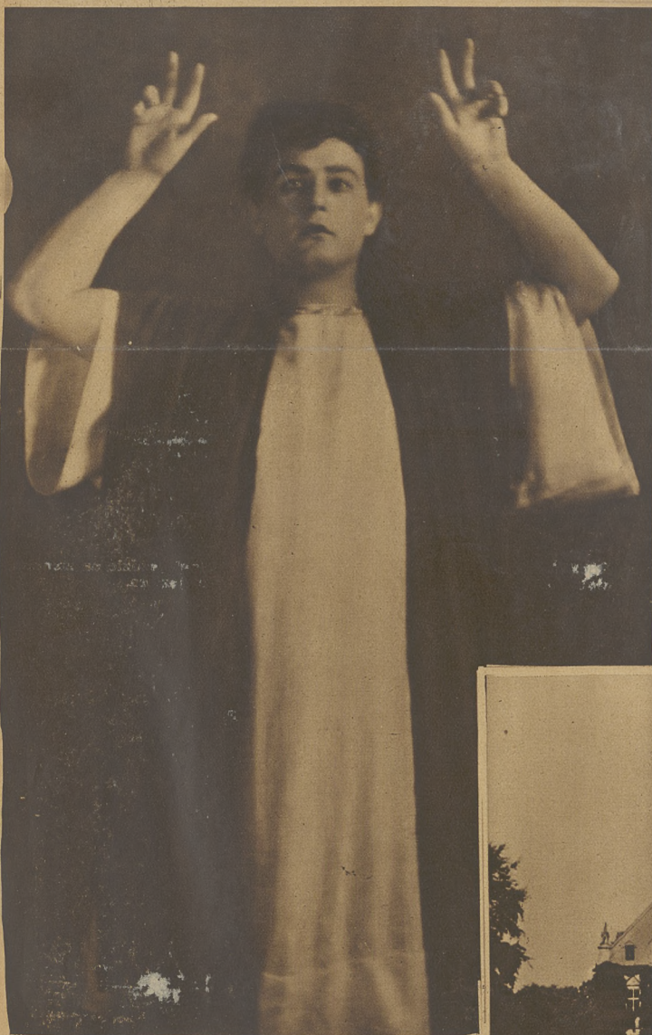
Jan Kiepura w roli „Obcego” w niedawno wystawionej operze „Cud Hellany” w państwowej operze wiedeńskiej.