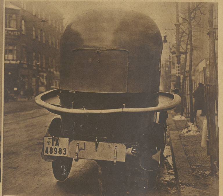
Oryginalna reklama wielkiego magazynu kapeluszy w Berlinie. Na lewo: Nowy pomnik Mustafy Kemal Paszy w Angorze.