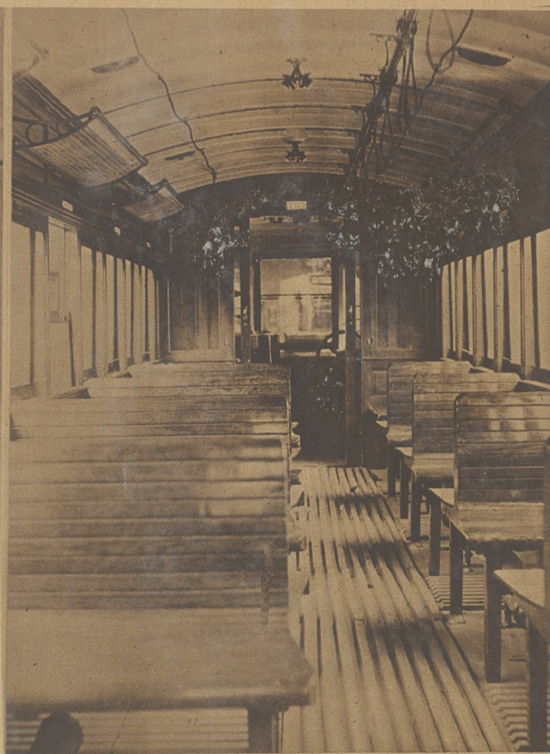
Tramwaje elektryczne w Zagłębiu Dąbrowskiem. Na lewo wóz tramwajowy. Na prawo wnętrze wozu.