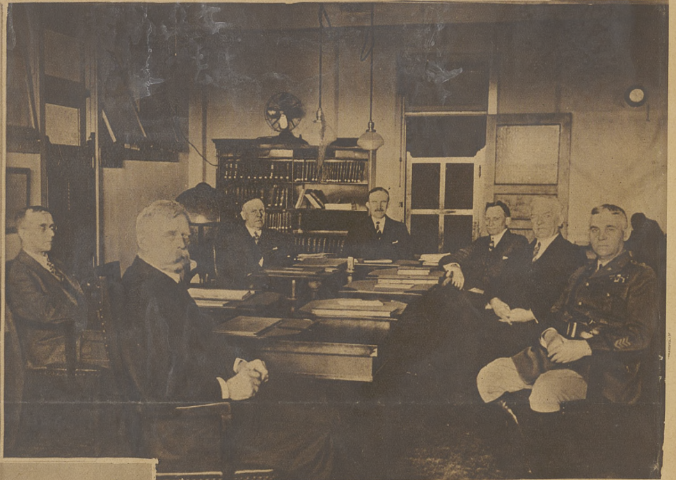
Mimo narad nad powszechnym rozbrojeniem, łączących się w Genewie, w Ameryce dowódcy Armii i Floty obradują nad zagadnieniami obrony.