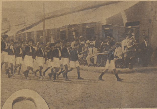
Zdjęcia nasze przedstawiają pochód organizacyjnej faszystowskiej młodzieży włoskiej.