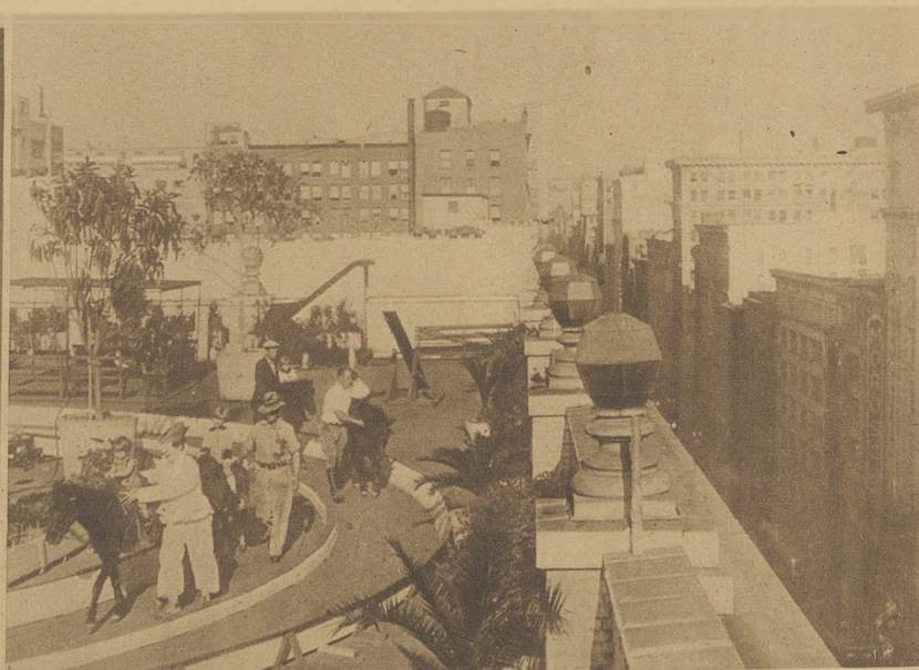
Wielki amerykański bazar handlowy urządził na dachu budynku rodzaj parku rozrywkowego dla dzieci, gdzie rodzice mogą podczas zakupów pozostawić swe pociechy,