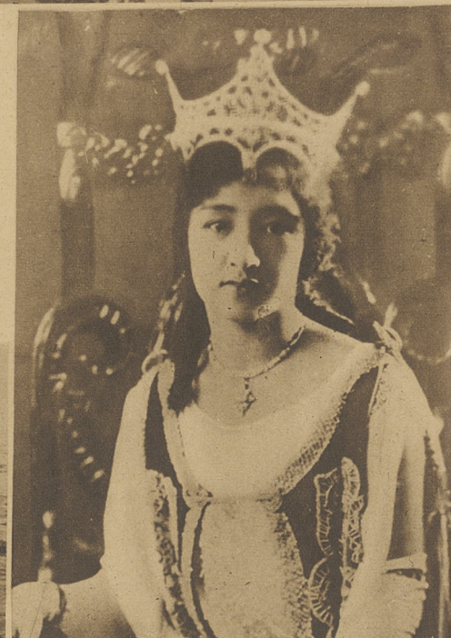
Panna Catalina Apacible, obrana królową piękności na Filipinach, podczas oficjalnego balu przemysłowców.