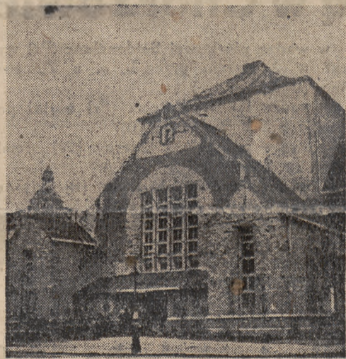
Prace remontowe w pełnym toku. Niedługo ziszcą się marzenia poznańskich pływaków — pływalnia zostanie oddana do użytku. Artykuł o urządzeniach pływalni, jej stopniu zniszczenia jak i przebiegu prac remontowych zamieścimy w następnym numerze.