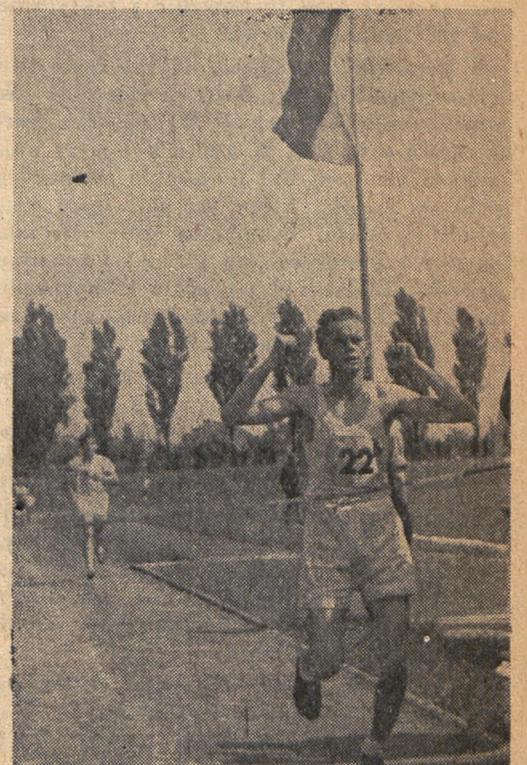
zwycięzca w biegu młodzików podczas Święta Sportu Robotniczego