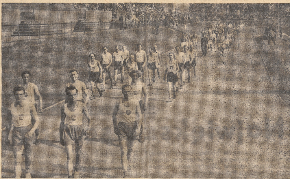
w dniu Święta Sportu Robotniczego w Poznaniu