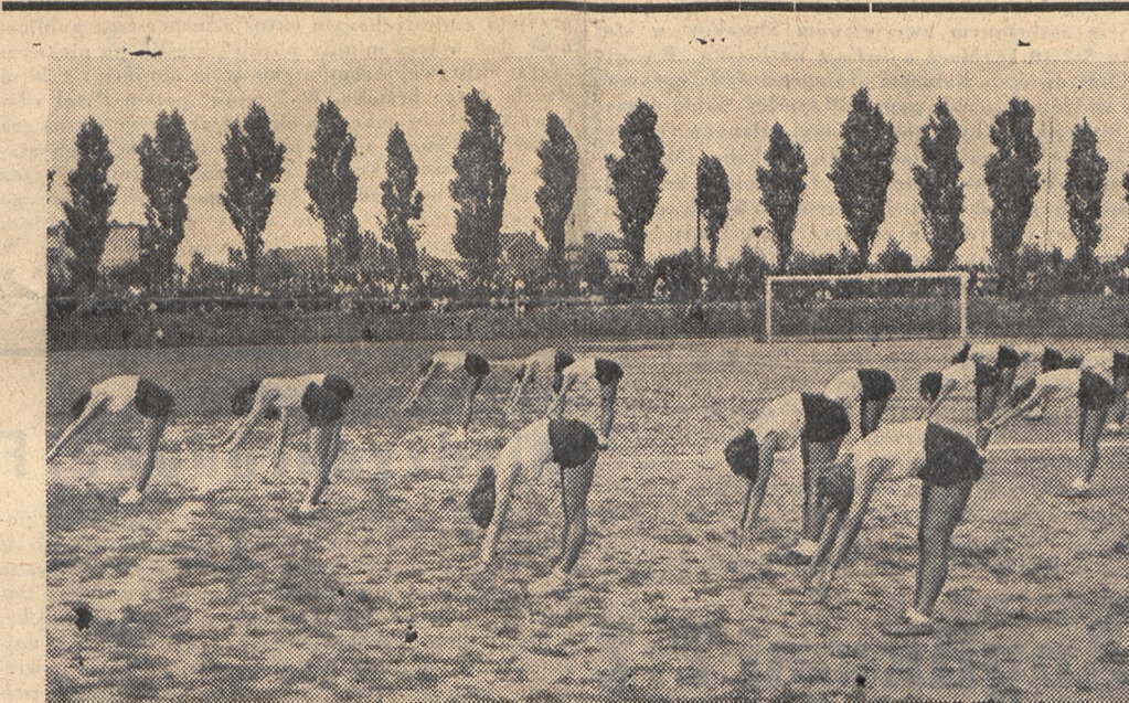
Panie Studium WF Uniwersytetu Poznańskiego podczas pokazu „Dnia sprawności fizycznej”.

Sędziował w ringu ob. Gruszczyński, na punkty ob. ob. Rozmarynowski (Pomorze), Leżohupski i Kowalski (Poznań). Widzów około 1000 osób. Życzyć by należało, aby inicjatywa obu okręgów — rozgrywania spotkań młodzików — znalazła jak najrychlejsze naśladowictwo w innych okręgach bokserskich Polski, co przyczyni się na pewno do wyłowienia talentów i podniesienia poziomu boks polskiego. (al)