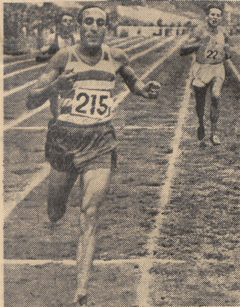
rewelacyjny biegacz francuski, zwycięzca w Oslo na 3000 m z przeszkodami