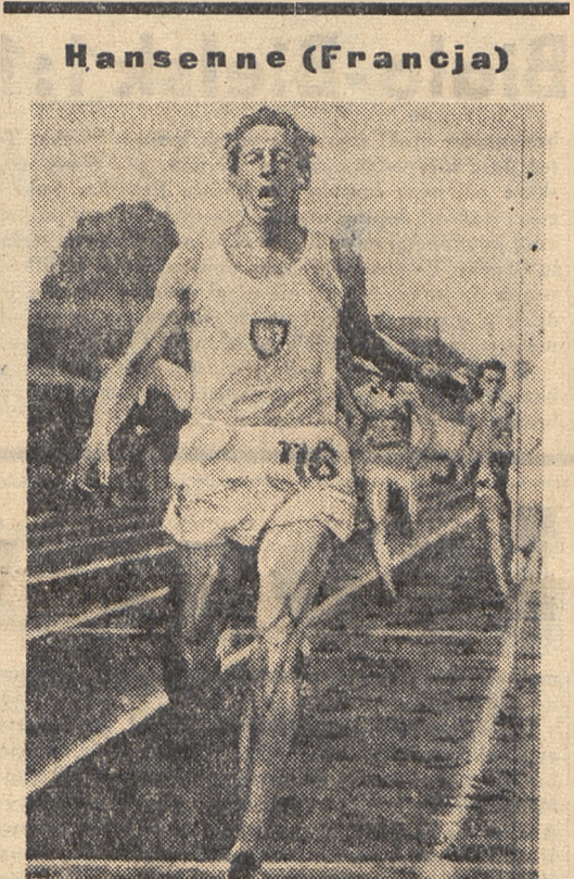
który ostatnio pobił w biegu na 800 m mistrza Europy Gustafssona (Szwecja).

Pragnąłby jak najszybciej w silnej konkurencji zaatakować rekord światowy na 100 m. stylem dowolnym — a tą silną konkurencją jest właśnie Allan Ford.