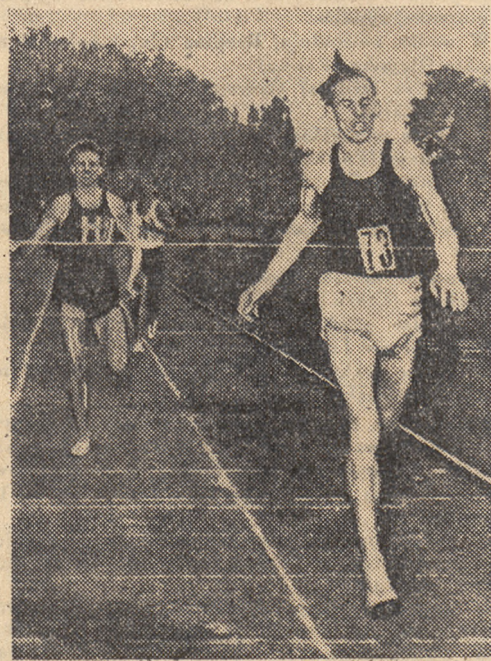
mistrz Szwecji i rekordzista świata w walce ze swoim rodakiem Arne Anderssonem