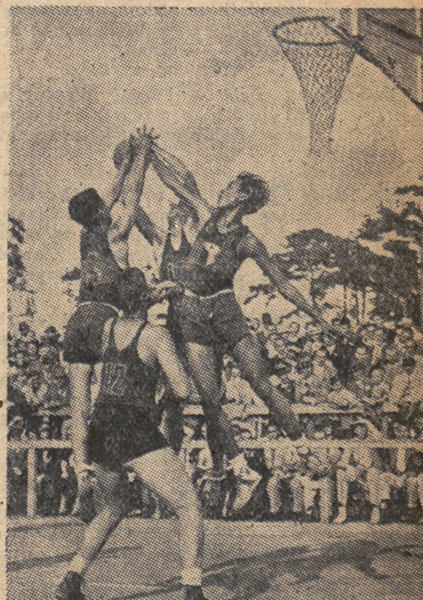
Wspaniały moment pod koszem podczas meczu Filipiny—Meksyk na ostatniej olimpiadzie, wygranym przez filipińczyków w stosunku 32:30