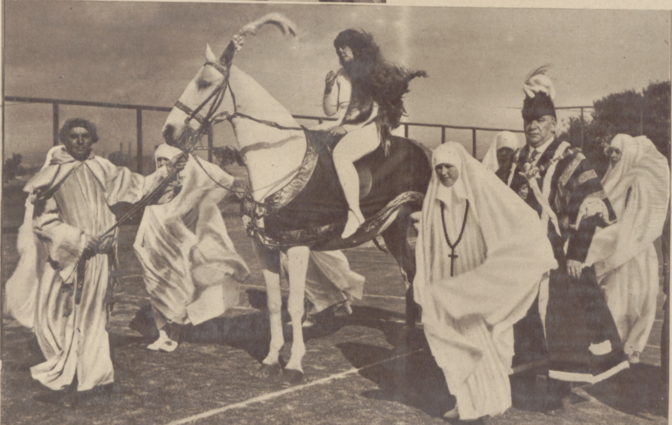
Ulubiony temat angielskich uroczystości „Lady Godiva“ w otoczeniu mnichów i mniszek.