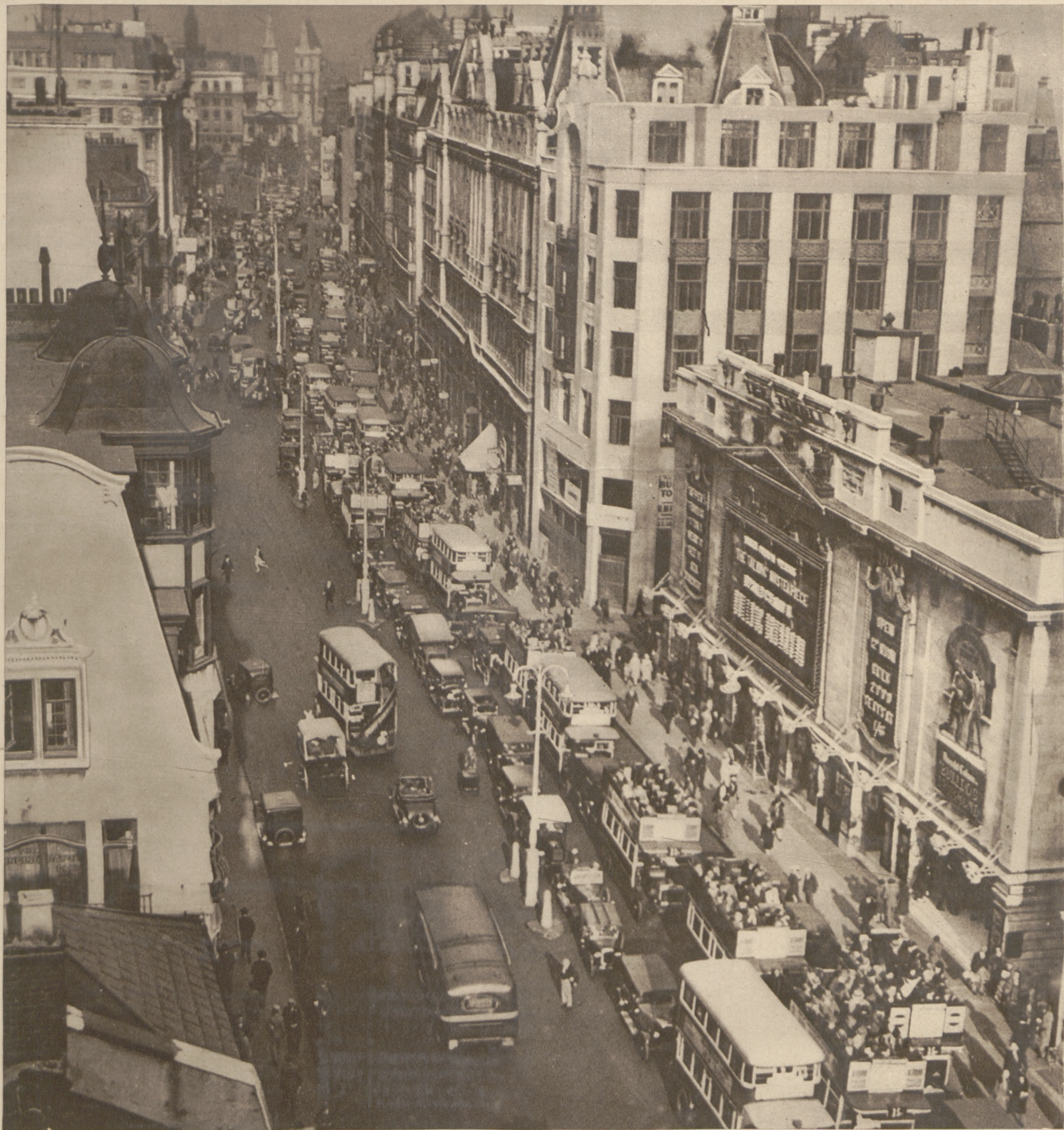
Widok najbardziej ożywionej arterji Londynu Trafalgar Square, którą pokrywa się obecnie nową nawierzchnią asfaltową. Z tego powodu ruch kołowy ograniczony jest do jednej połowy ulicy.