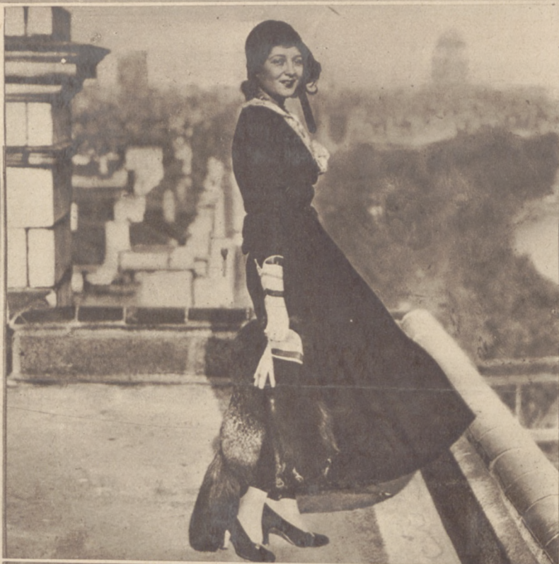
Na lewo: Słynna gwiazda filmowa Lya de Putti na tarasie hotelu w Londynie.