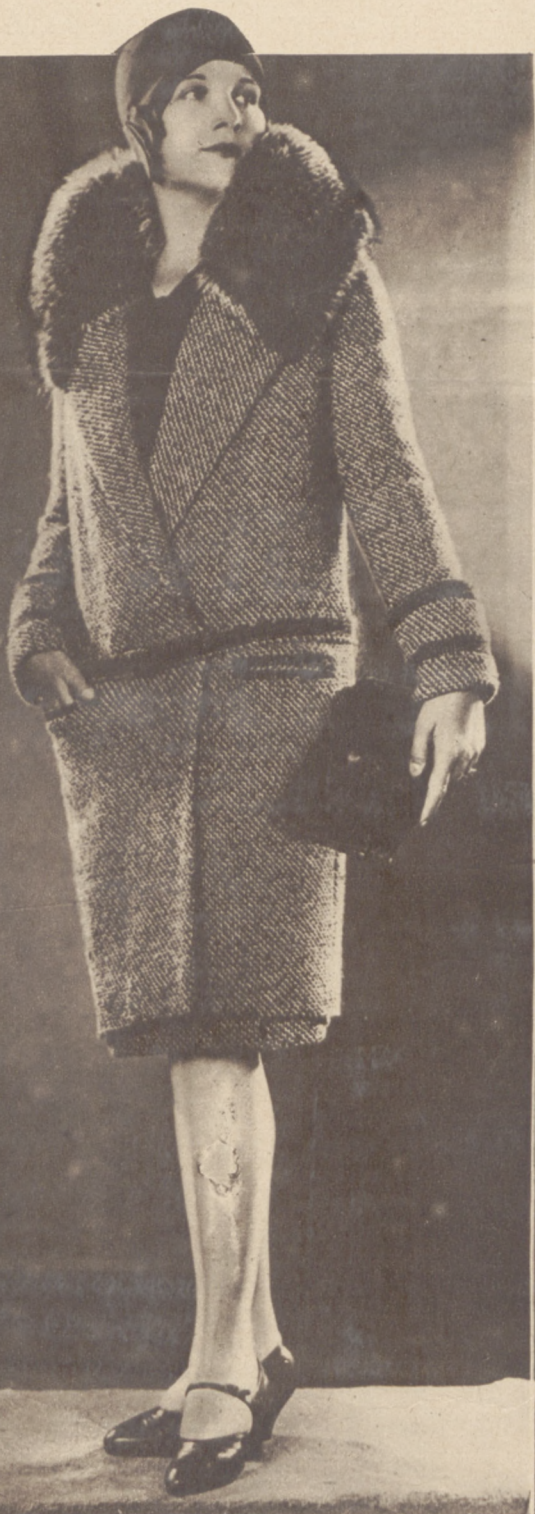
Płaszcz jesienno-zimowy z kołnierzem futrzanym, utrzymany w tonie brązowym.