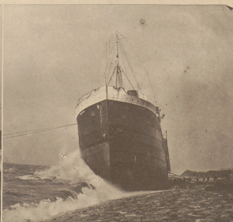
Okręt niemiecki „Eugenia” rzucony został na mieliznę przy wybrzeżu holenderskim. Według praw morskich okręt taki, o ile w ciągu roku nie zostanie uruchomiony, staje się własnością kraju na którego wybrzeżu jest uwieczony.