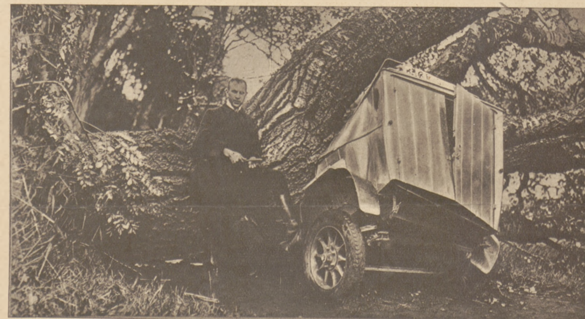
Rzadki wypadek rozbicia auta przez spadające drzewo zdarzył się koło Świnouścia.