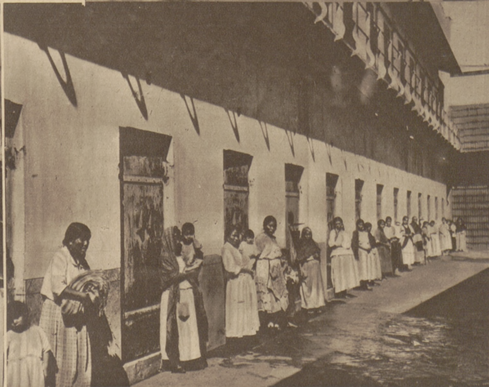
Zdjęcia z największego więzienia w Meksyku. Na lewo wnętrze oddziału męskiego. Na prawo aresztantki z dziećmi przed celami.