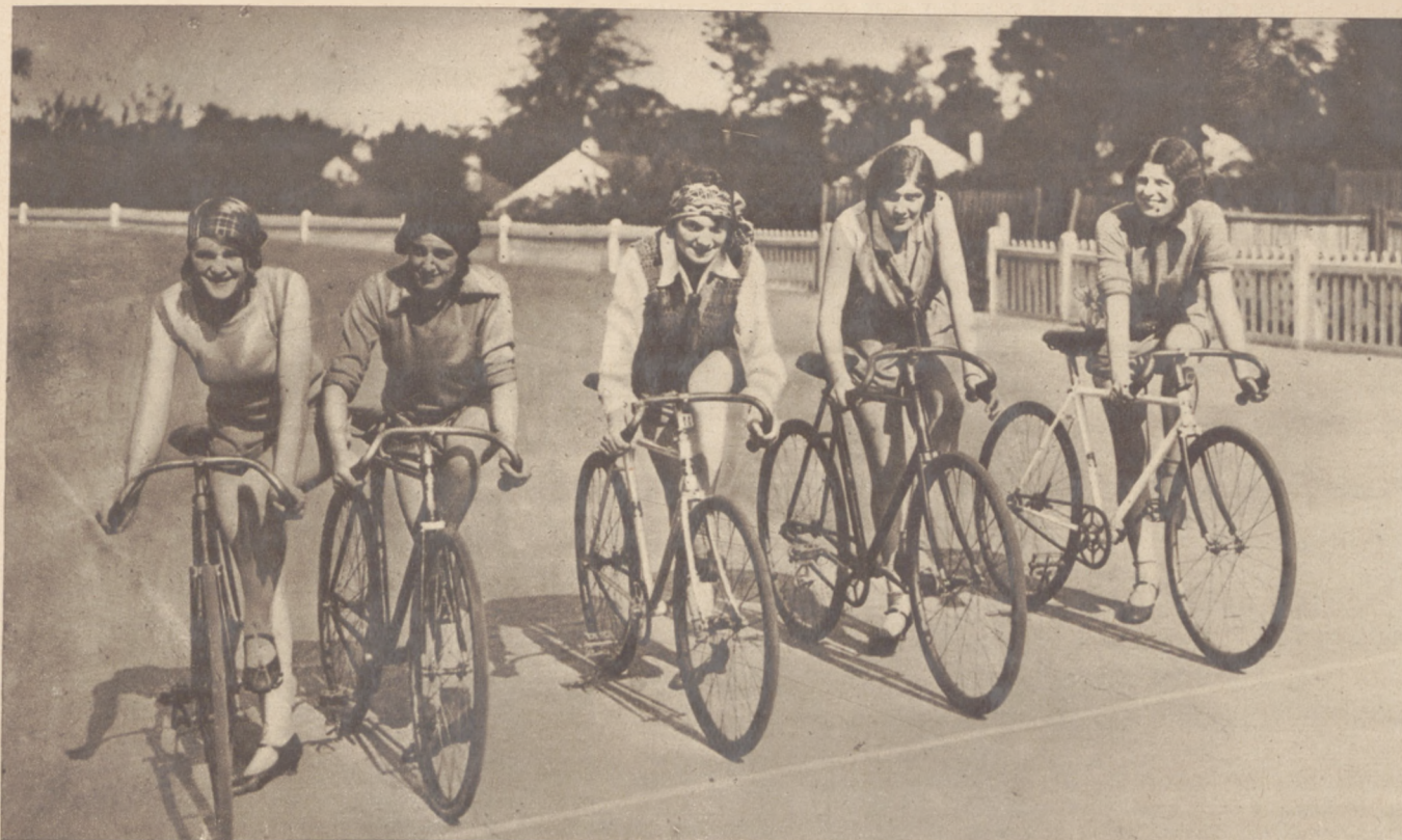
Zwyciężynie w biegu kolarskim chórzystek teatralnych w Londynie.