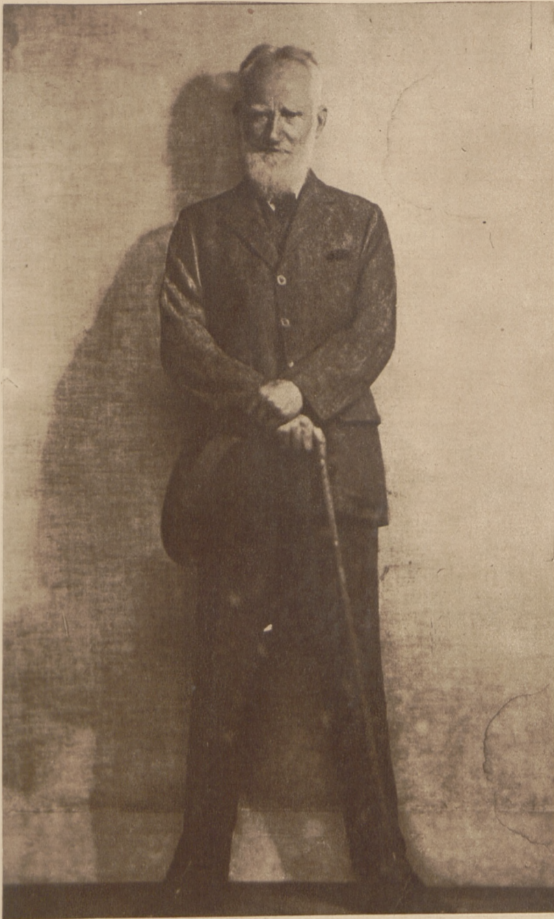
Ostatnie zdjęcie G. B. Shawa, znakomitego autora rewelacyjnej komedji „Wielki Kram” której premjera odbędzie się na scenie miejsk. Teatru Wielkiego we Lwowie, w sobotę 5 października br. w interpretacji artyst. „Teatru Premier” z Junoszą-Stępowskim w głównej roli króla, poczem „Teatr Premier” udaje się z tą sztuką w podróż artyst. po całej Polsce.