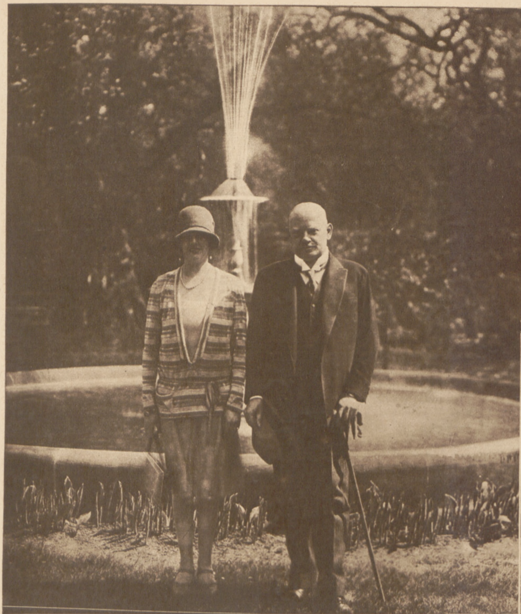
Jedno z ostatnich zdjęć przedstawiające zmarłego ministra spraw zagranicznych Niemiec, Stresemanna wraz z małżonką na przechadzce.