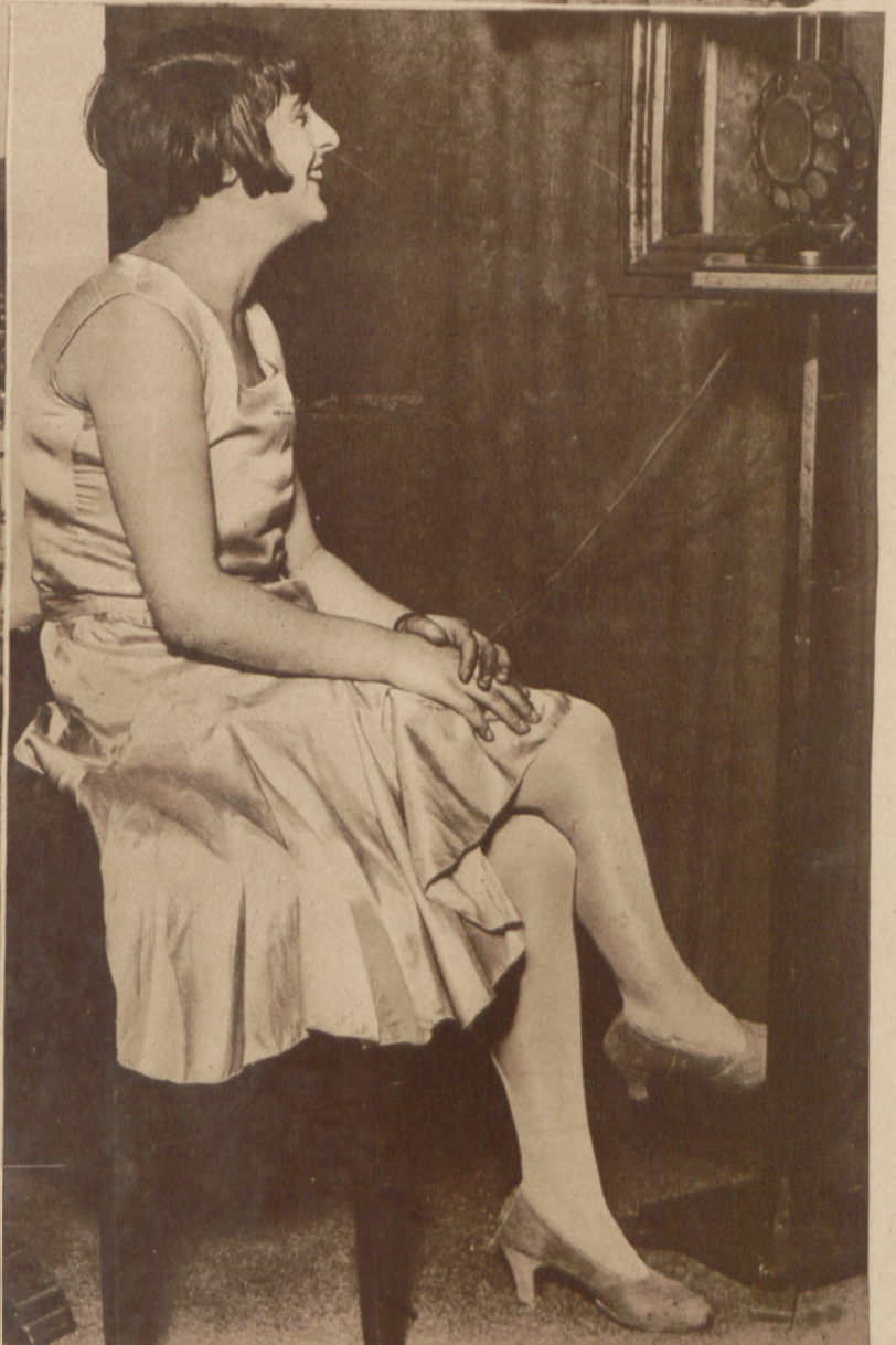
Na prawo: Próbną audycją radio londyńskiego połączona z telewizją. Słuchacze mogli widzieć śpiewaczkę śpiewającą do mikrofonu.