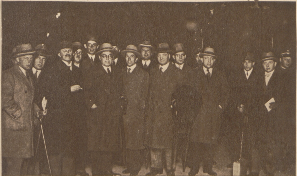
Do Warszawy przybyli dziennikarze niemieccy z Poznania, gdzie zwiedzili P. W. K. Zdjęcie nasze przedstawia uczestników wycieczki na dworcze Warszawa Główna.