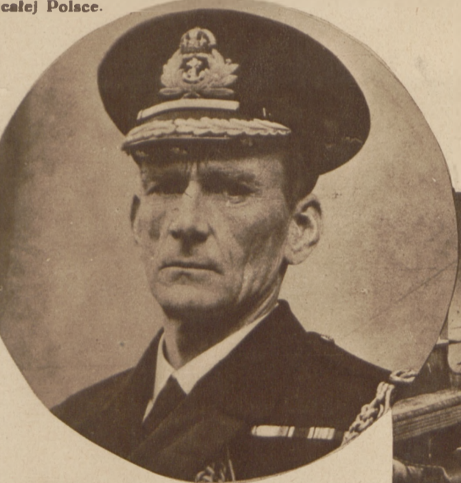
Na lewo: Komandor Melville Hawes attache morski poselstwa angielskiego w Warszawie, objął to stanowisko po komandorze Nash.