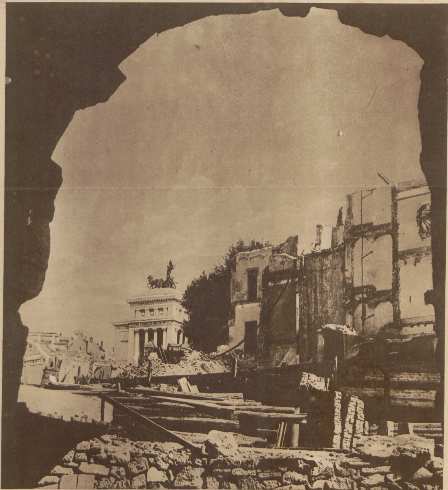
W roku Rzymu demoluje się obecnie szereg potężnych nowoczesnych gmachów, celem odsłonięcia starorzymskich ruin. Zdjęcie nasze przedstawia prace koło odsłonięcia słynnego teatru Marcellusa.