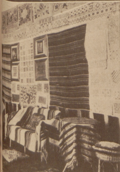
Średnia szkoła za- wodowa w Skalce: Wystawa prac kursu tkackiego.