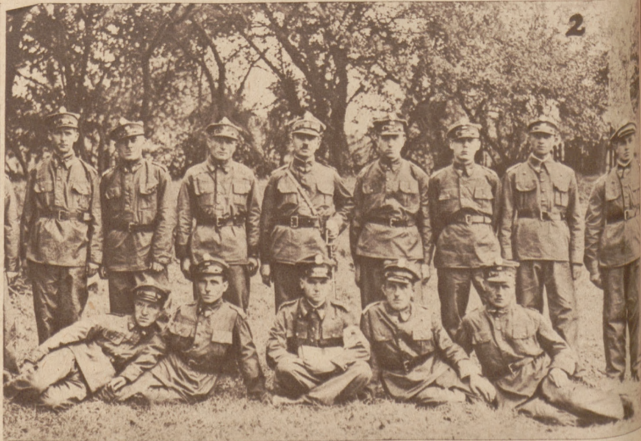
(1, 2, 3) Kompanja Kolejowego Przysposobienia Wojskowego w Dąbrowie Górniczej.