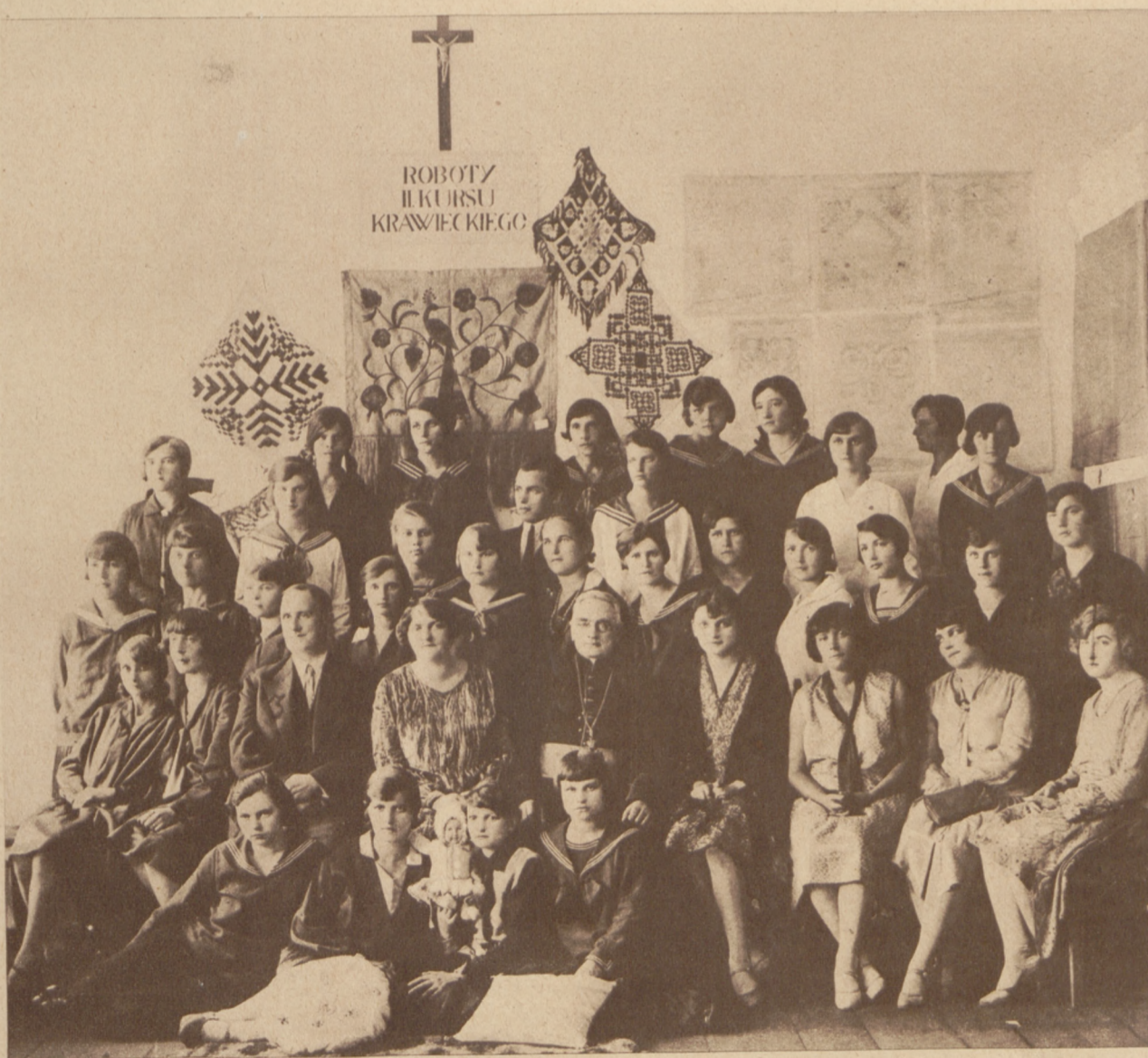
Średnia szkoła zawodowa w Skalce: grono nauczycielskie i uczeń.