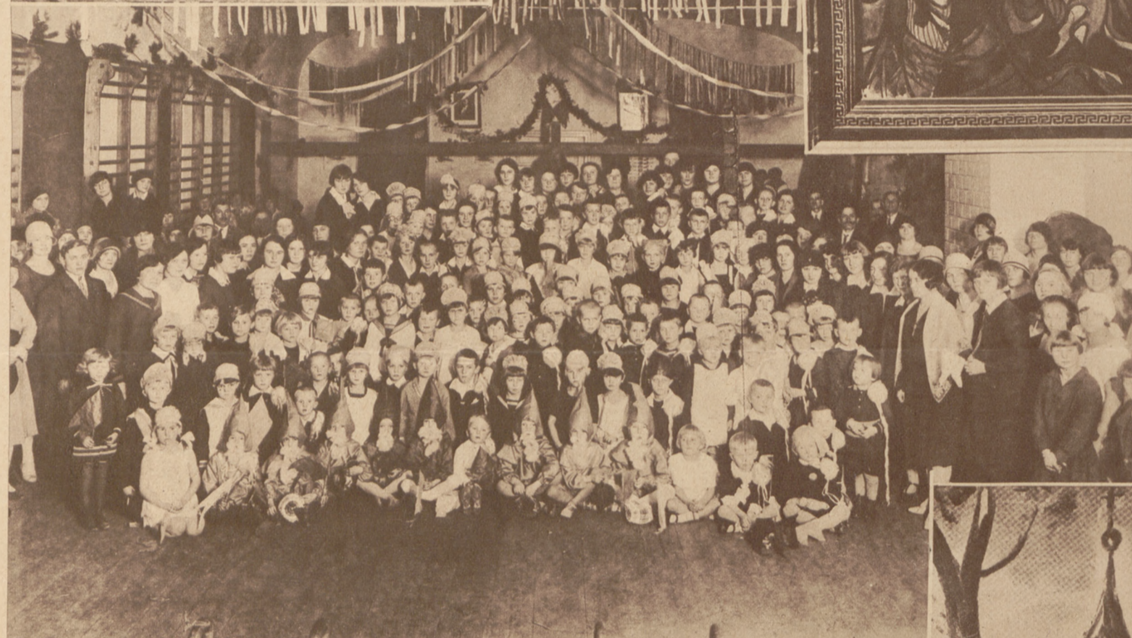
Na lewo: Z tygodnia Dziecka w Sosnowcu: Szkoła ćwiczeń przy seminarjum żeńskim.