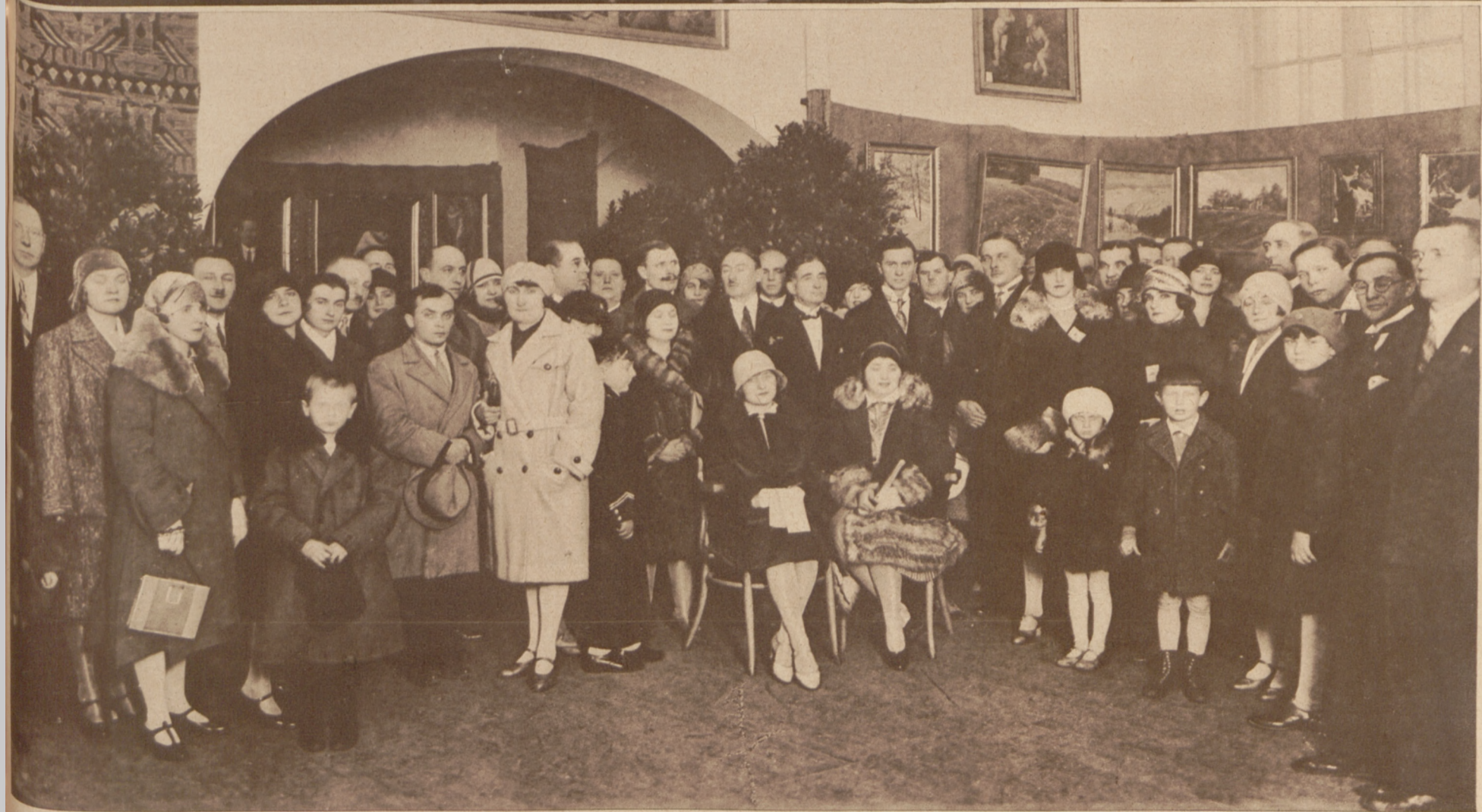
Otwarcie Wystawy obrazów w Sosnowcu, zorganizowanej przez Towarzystwo artystyczno-literackie (u góry tryptyk art.-mal. Detkego „Zagłębienie”).

U góry: Walne zebranie Izby przemysłowo-handlowej w Sosnowcu.