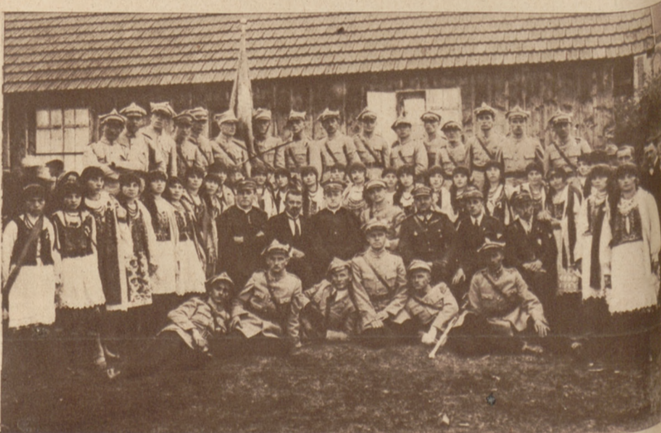
Chorągiew Związku Hallerczyków Zagłębia Dąbrowskiego na uroczystości poświęcenia sztandaru S. P. M. M. w Smardzewicach.