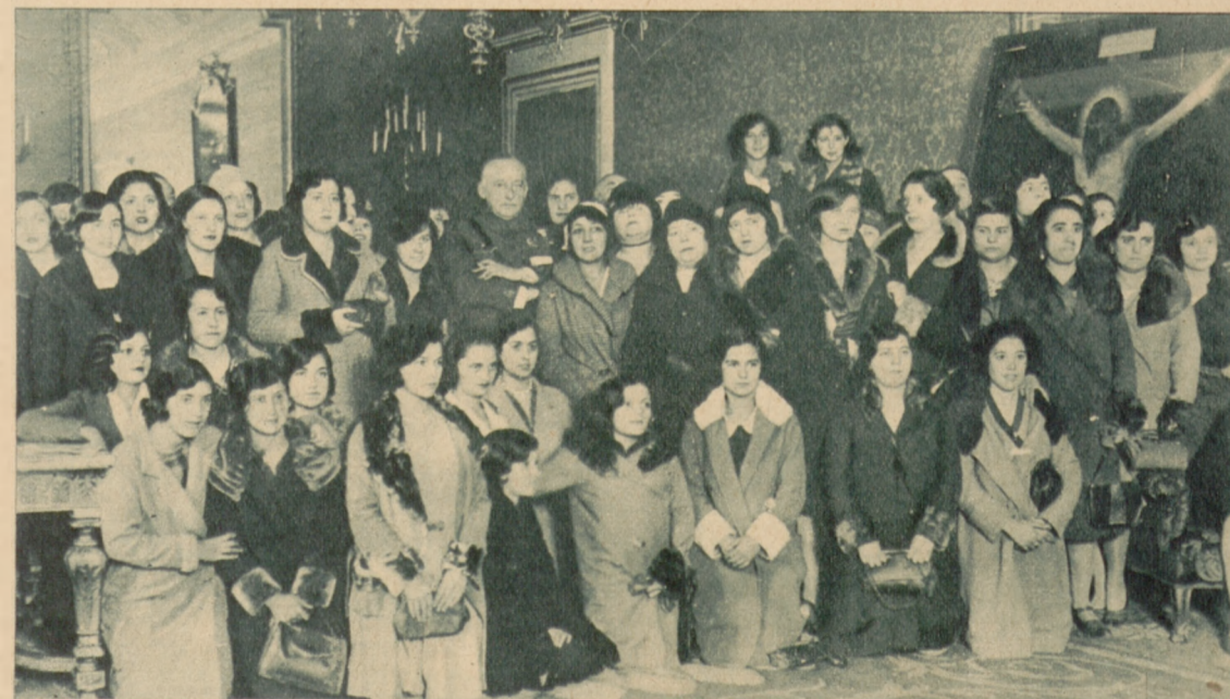
Dyktator hiszpański Primo de Rivera w otoczeniu modystek madryckich, które zwróciły się do niego z prośbą o zaopiekowanie się ich ciężką dolą.