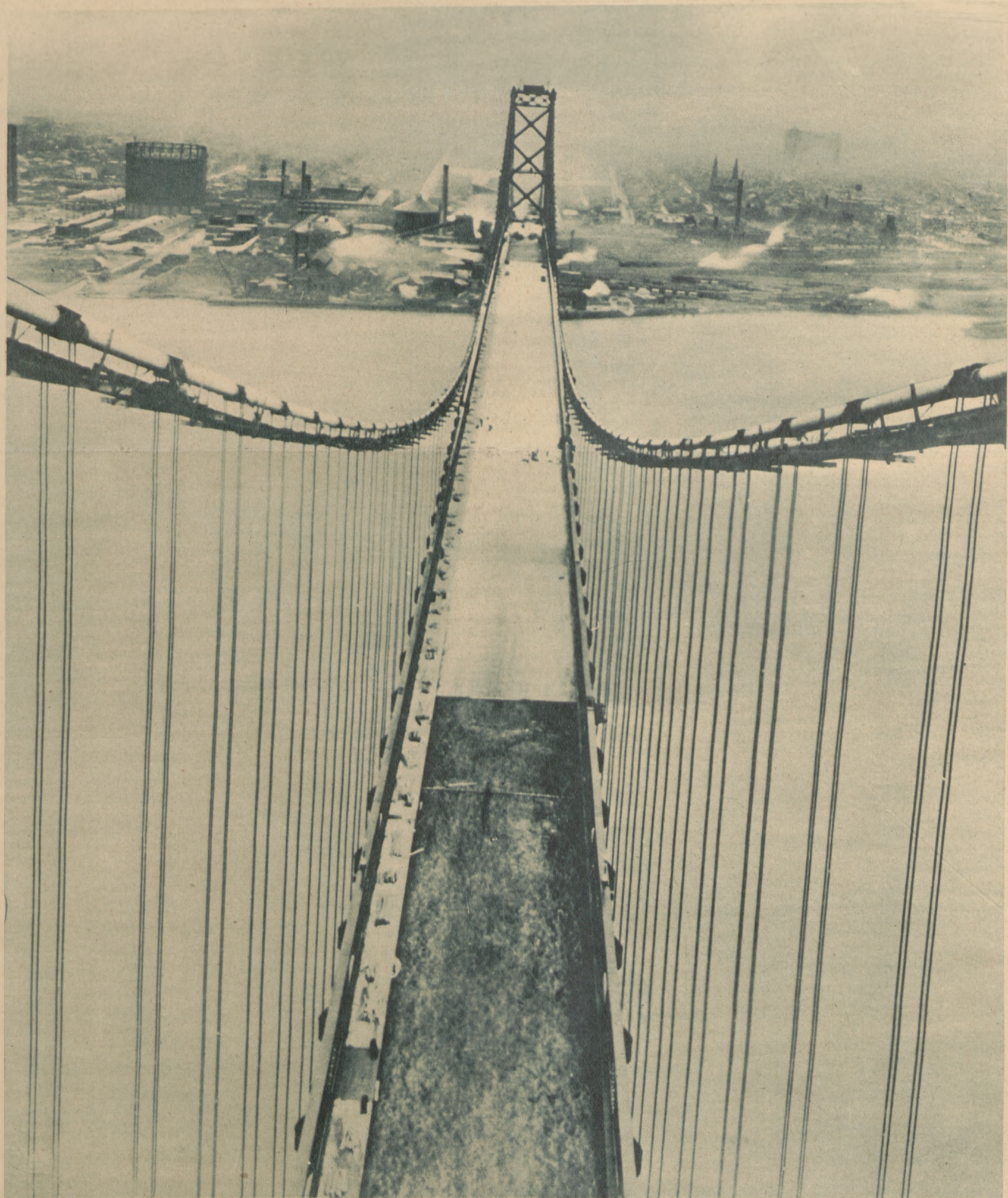
Największy most wiszący świata znajduje się w Detroit (Stany Zjednoczone). Rozpiętość między dwoma wieżami wynosi ok. 300 m. Przez most może jechać równocześnie obok siebie 5 pojazdów.