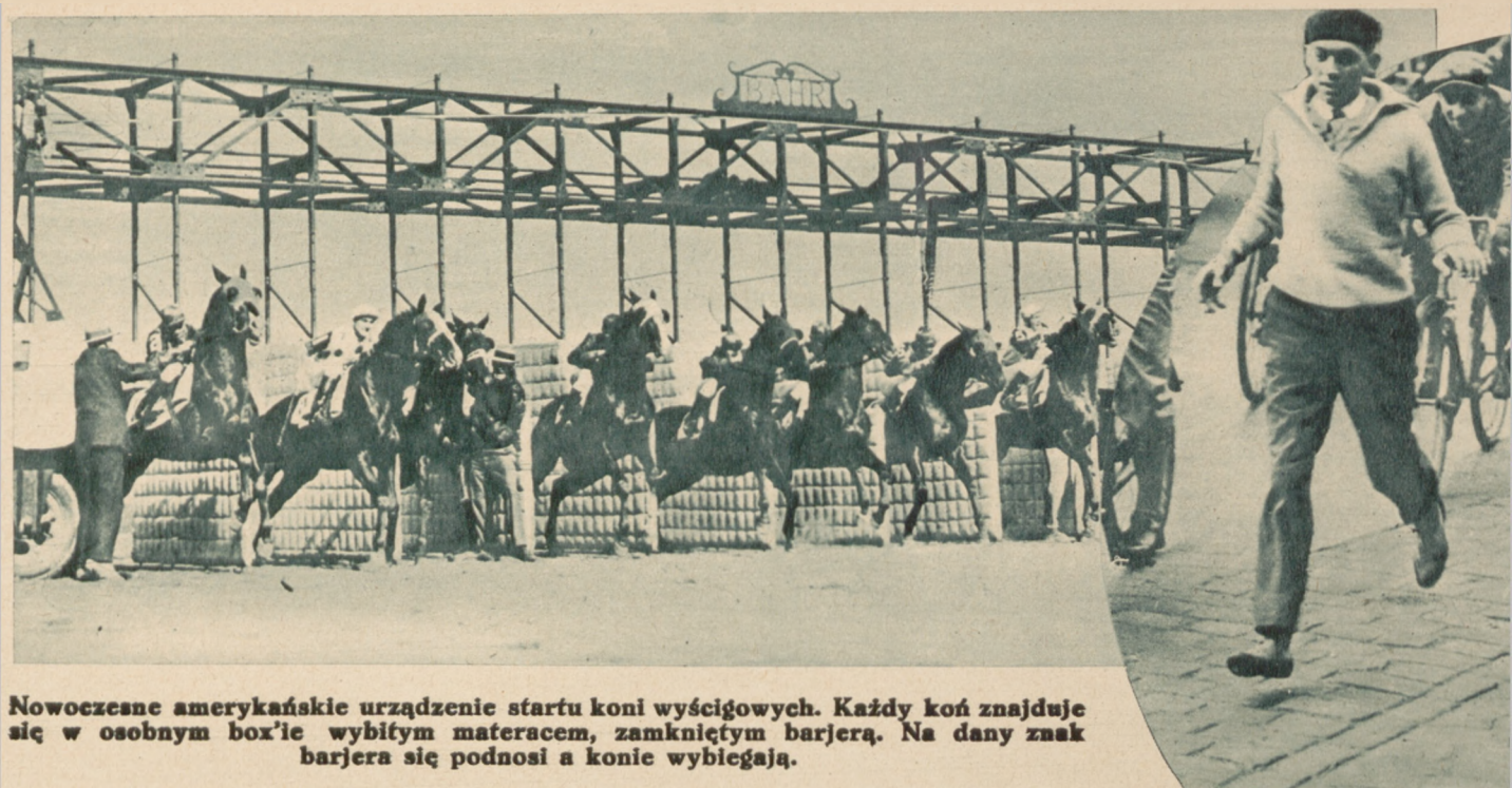
Nowoczesne amerykańskie urządzenie startu koni wyścigowych. Każdy koń znajduje się w osobnym box'ie wybitym materacem, zamkniętym barjerą. Na dany znak barjera się podnosi a konie wybiegają.