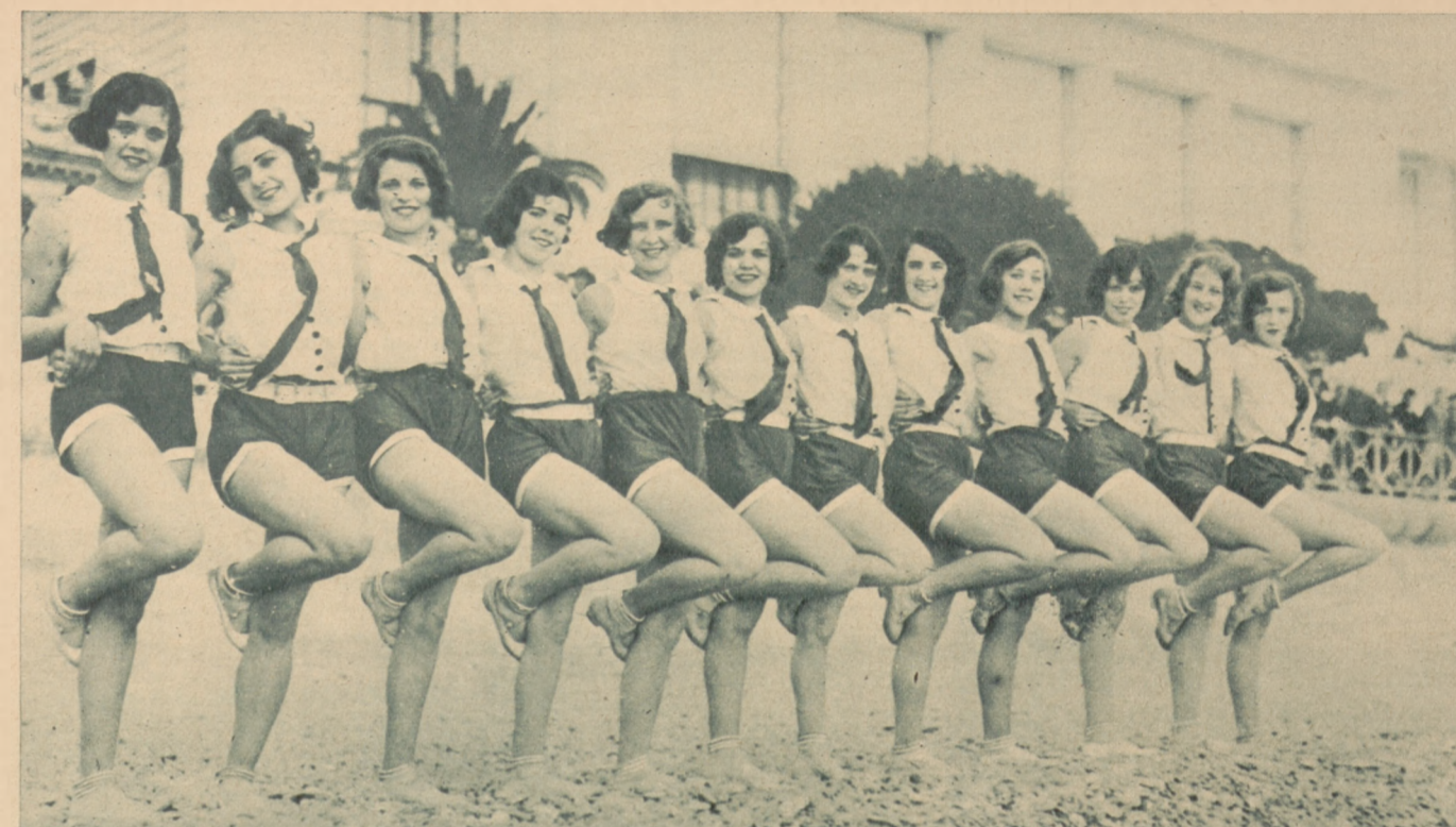
Balet słynnego kabaretu paryskiego Folies Bergere, przygotowuje się na Rivierze do świątecznych występów.