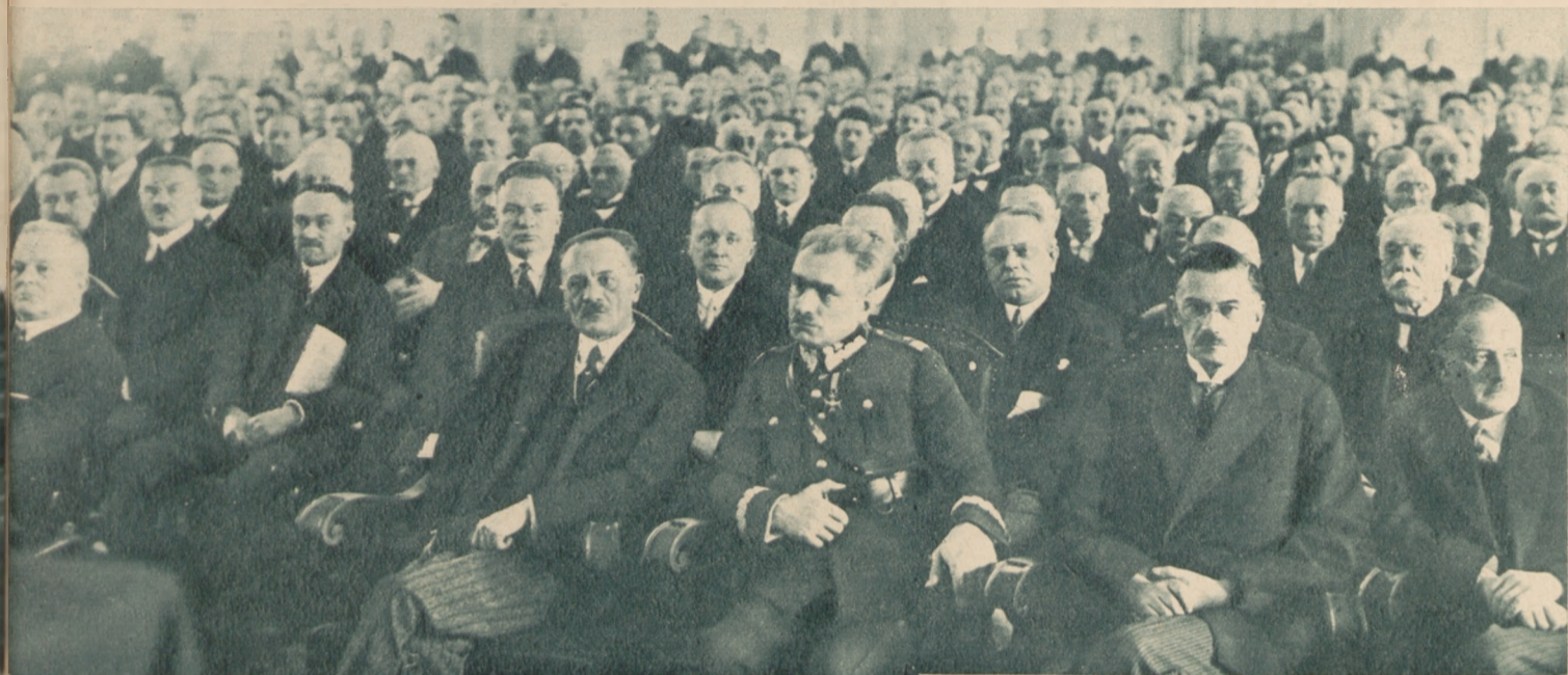
Na lewo: Plenum obrad konferencji przed- stawicieli izb lekarskich w sali Rady Miejskiej. W pierwszym rzę- dzie siedzą: premier Świątalski, min. Stawoj-Składkowski, minister Kühn, min. Boerner, marszałek Szymański.