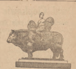
SYMBOL ROLNICTWA NA P. W. K.

Odpowiedzialnosć za naruszenie wszystkich tych przepisow normujaj odpowiednie ustawy karnie.