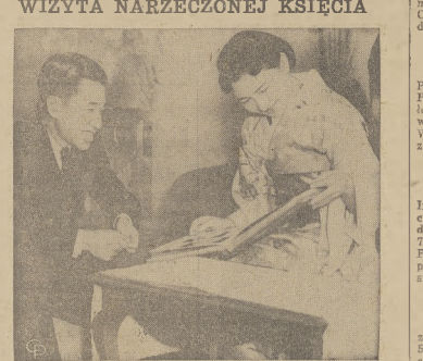
Na zdjęciu książkę krwi Aki- hito i narzeczoną Michiko Shoda w tymczasowym pałacu w Tokio oglądają album z fo- tografiami. Zaślubiny tych dwojga mają się odbyć w kwietniu b. r.