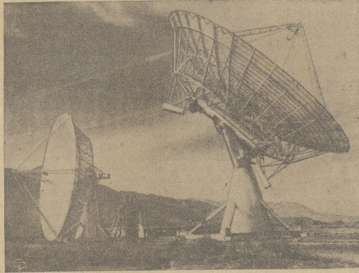
Na zdjęciu dwa radioteleskopy znajdujące się w nowym obserwatorium Caltech, które położone jest w dolinie Owen, Bishop, Calif. W pierwszych dwóch dniach osiągnęły one jeden bilion lat świetlnych w przestrzeni. Rok świetlny jest to odległość, którą światło przebiega w ciągu roku z szybkością 385,000 mil na sekundę.