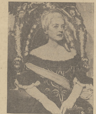
Wybitnie zdolna i piękna artystka filmowa Bette Davis najbardziej po królewsku wystąpiła w ostatnio nakręconym jej filmie w roli carskiej Katarzyny Wielkiej.