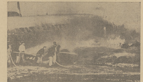
Samolot z siedemnastoma pasażerami, znajdujący się w drodze do Detroit na skutek palącego się silnika, przymusowo wylandował na lotnisku Międzynarodowym w Miami, Fla. Pilot kierujący samolotem, wraz z szesnastoma ludźmi znajdującymi się na pokładzie wylądował bez szwanku.