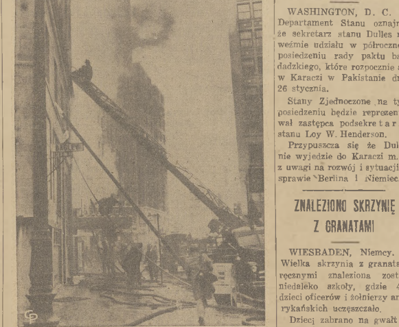
Na zdjęciu strażacy wspinają się w pośpiechu po drabinie, celem uwolnienia ludzi znajdujących się wewnątrz 14 piętrowego obiętego pożarem hotelu znajdującego się w śródmieściu w Detroit. Ogień ten powstał na parterze i z błyskawiczną szybkością objął cały budynek w którym trzy osoby poniosły śmierć a 14 doznało obrażeń.