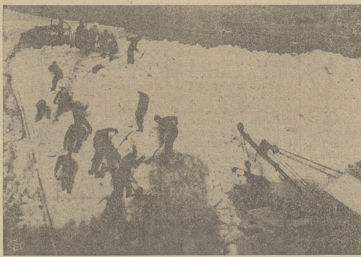
W przygotowaniach uwolnienia uwięzionego wśród lodu okrętu za pomocą wypompowania ładunku olejowego do obok stojących beczek, Straż Nadbrzeżna odgarnia śnieg i lód z okrętu-cysterny w Tolchester, Md.