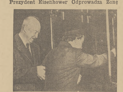
Zdjęcie powyższe zostało zrobione, podczas wleidy prezydent Eisenhower pomaga żonie Mamie, udającej się na kuzację do Phoenix, Ariz.