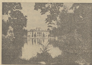
ŁAZIENKI — WARSZAWA

WŁĄCZA: Przelot z New Yorku do Warszawy i z powrotem, klasę Economy; 10-dniową turę po Polsce zwiedzając: Poznań, Wrocław, Częstochowę, Kraków, Wieliczkę, Zakopane i Warszawę — łącznie z hotelami 1-ej klasy, 3 posiłki dziennie, podróże, zwiedzanie, usługi przewodnika, etc.