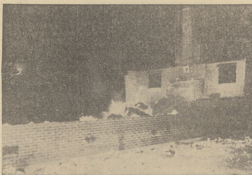
W pożarze szkoły przemysłowej dla Murzynów w stanie Arkansas położonej 12 mil od Little Rock 21 chłopców poniosło śmierć. Chłopcy podczas wybuchu potrawili byli zamknięci wewnątrz budynku, a chorego dozorca, szkoły był nieobecny m. w tym czasie.