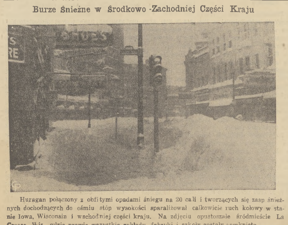
Huragan połączony z obfitymi opadami śniegu na 20 cali i tworzących się zasp śnieżnych dochodzących do ośmiu stóp wysokości sparaliżował całkowicie ruch kołowy w stanie Iowa, Wisconsin i wschodniej części kraju. Na zdjęciu opustoszałe śródmieście La Crosse, Wis., gdzie prawie wszystkie zakłady, fabryki i szkoły zostały zamknięte.