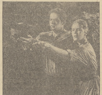
Sen Piazza i Maria Schell w jednej z scen filmu p. t. "The Hanging Tree", w której nie może być mowy o charakterystyce.