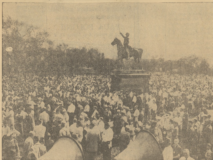
150 tysięcy Polaków Chicagońskiej wiosła udział w bezcennej Manifestacji 3-Majowej, urządzanej pod pomnikiem Kościuski. Po wspaniałej paradzie, w której nie Augustus i Division wzięły udział, przy zamknięciu manifestacji pod pomnikiem Kościuski, wzniesiono sztandar, na którym znajdował się napis: "Solidność, honorowi i urzędowi urzędników w miastach i organizacjach polskich".

Tysięczno Tłumy Polaków w Parku Humboldt