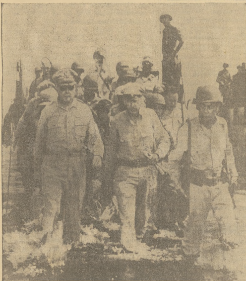
PROMISE WAS FULFILLED when General MacArthur waded ashore with his staff on Leyte in the Philippines in 1944 to launch the reconquest of the islands from Japan.