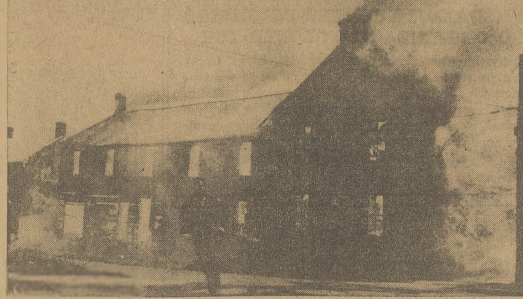
Na zdjęciu mężczyzna ucieka przed żarem z palącej się fabryki w Lanark, Ont., gdzie ogień z gwałtowną szybkością rozprzestrzenił się niszcząc 36 sklepów i 46 domów. Około 150 osób zostało pozabawionych dachu nad głową, a szkody wyrządzone pożarem są obliczane na dwa miliony dolarów.