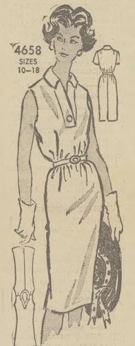
4658 SZYB 10-18 by Anne Adams

Łatwo do uszycia wyerasowa sukienka. Drukowane instrukcje. Nr. 4658 przychodzi w rozmiarach 10, 12, 14, 16 i 18. CENA MODELKA 50 CEN-TOW.