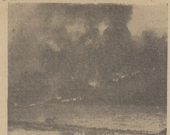
Wystraszona sarenka ucieka w panice przed strasliwym pożarem w Hidden Valley (Ukrytej Dolinie) Calif., oddalonej o kilka mil od granicy powiatowej Los Angeles. Około 200 mężczyzn brało udział w akcji gaszenia pożaru, nad którym stracono kontrolę.