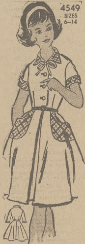
4549 SIZES 6-14