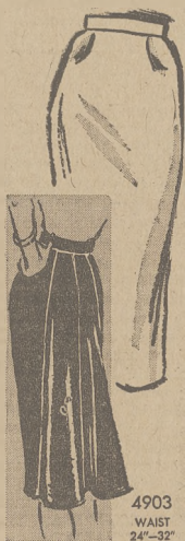
4903 WAIST 24"-32"