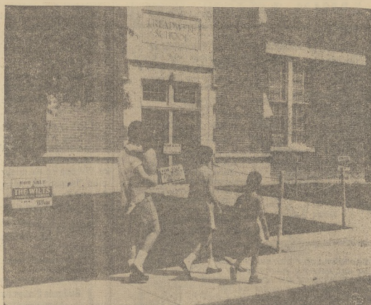
Dzieci uczęszczające do szkoły Treadwell w Memphis, Tenn. były bardzo rozczarowane napisami "For Sale", które zostały umieszczone przed przedłużoną wakacją szkolną.