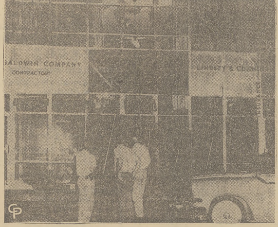
Detektywi z Little Rock, Arkansas stoją przed budynkiem w którym znajduje się prywatne biuro majora miasta, które zostało zniszczone przez jedną z 3 podłożonych w różnych miejscach bomb. Druga bomba zburzyła biuro