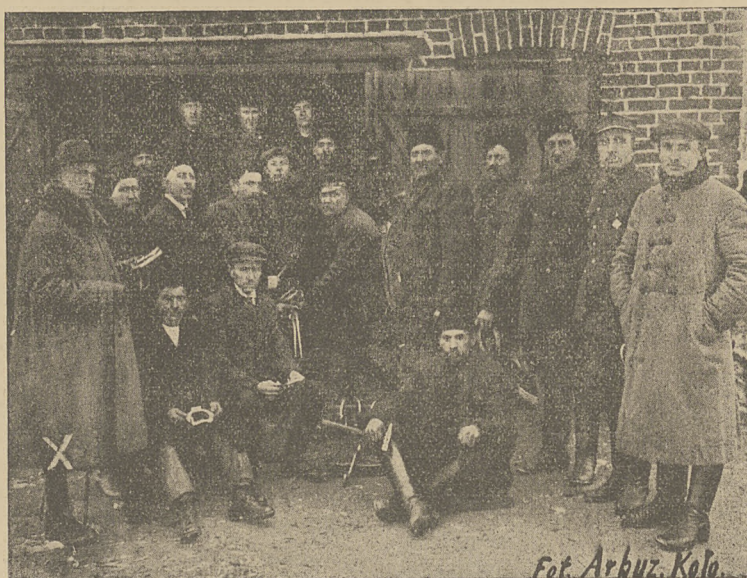
UCZESTNICY KURSU PODKOWNICTWA W KOLE. (Do artykułu: Kurs podkownictwa.)

logi z dokładnym podaniem o pochodzeniu i o zdatości wysyła bezpłatnie biuro stowarzyszenia Herdbuchgesellschaft w Gdańsku, Sandgrube 21.