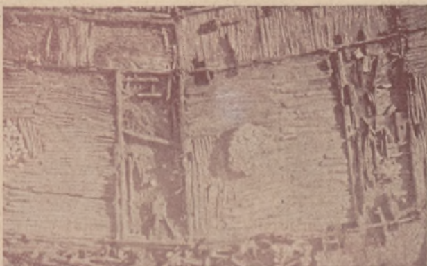
Na zdjęciu widzimy odkopaną drewnianą drogę, przejście między dwoma domami oraz paleniska z kamieni.

Osada w Biskupinie to dla nas wyraźny i jasny dowód, że od prawieków Słowianie są panami tych ziem. Dziś świat już o Biskupinie wiele wie. Dowie się jeszcze więcej, gdyż praca jest obliczona na lat 7 i wszystkie czynniki w państwie z Panem Prezydentem Mościckim na czele nią się zainteresowały. To też mając to znalezisko pod bokiem, obowiązkiem wszystkich nas jest zwiędzić i mówić szeroko o nim swym najbliższym.