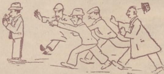
Pan z „ogniem”