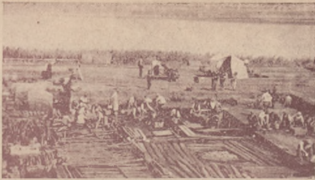
Żmudna praca przy odkopywaniu cennego znaleziska.

A jak wyglądała gospodarka mieszkańców osady?