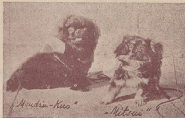
Wielkim powodzeniem cieszyła się zorganizowana przez Klub Kynologów w Toruniu wystawa psów. Na zdjęciu naszym widzimy dwa nagrodzone pinczerki.