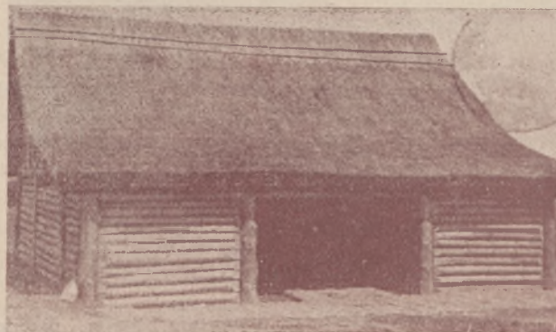
Zrekonstruowana chata z przed 2500 lat.

Praca nad odkopywaniem jest niezmiernie żmudna. Trzeba bowiem małą łopateczką brać po parę centymetrów ziemi, którą następnie w rękach przesiewa się, aby nic godnego nie uszło uwagi. Wielu ludzi pracuje nad usunięciem warstwy około 1 m torfu, a pod tym torfem dopiero znajduje się cała misterna budowa z drzew. Ile było tam kiedyś wybudowanych domów, będzie można określić dopiero wtedy, kiedy wszystkie prace odkrywcze zostaną zupełnie ukończone. To, co zeszłego roku odkopano, na zimę z powrotem zasypano, aby uchronić przed ujemnymi wpływami atmosferycznymi. Dziś odkrytych jest około 40 domów, z których zachowały się tylko podłogi, słupy boczne, droga drewniana, prowadząca obok domów, ogniska domowe i falochrony. Można mieć wyobrażenie, jak były domy budowane, gdyż przed wejściem do znaleziska zostały one odtworzone. Takich domów moglibyśmy dziś na Pomorzu wiele jeszcze spotkać, za wyjątkiem tylko tego, że nie miały okien, a światło wpadało przez szerokie drzwi. Przed zalewem chronił osadę silny falochron. Są to jeszcze dziś widoczne grube bale, wbijane w jezioro. Na pierwszą pale nakładano drugie, trzecie i t. d. Za tą pierwszą zastłoną kładziono znowuż pale, z których tworzone coś w rodzaju komór zamkniętych.