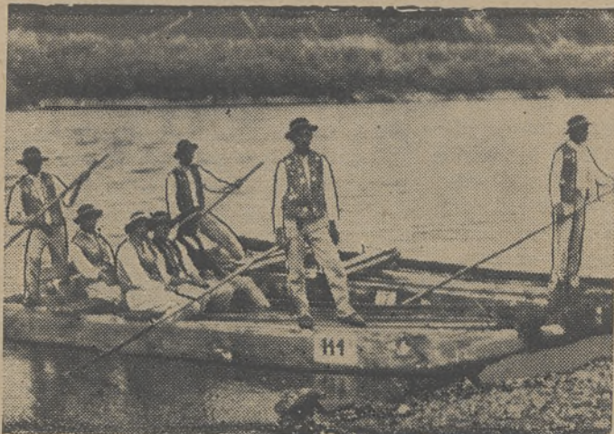
Nie każdy górak może zostać flisakiem na Dunajcu. Musi przed tym złożyć specjalny egzamin przed komisją. Na zdjęciu grupa kandydatów na flisaków pienińskich podczas egzaminu.