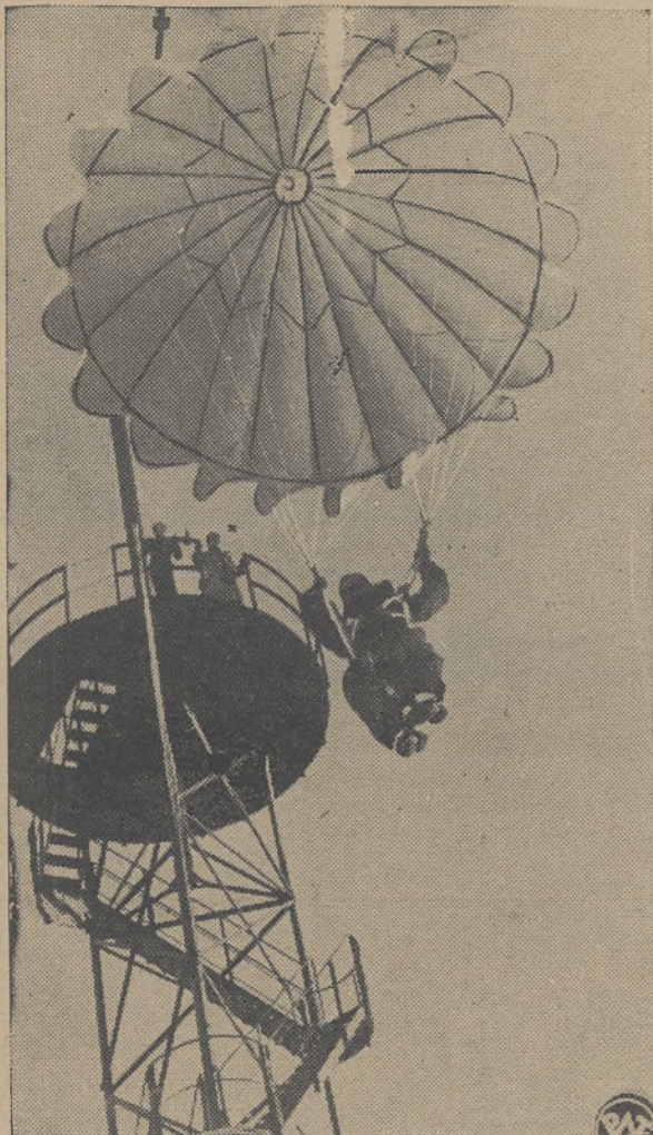
Wieża skoków spadochronowych w Kielcach, wybudowana przez miejscowy okręg L. O. P. P.

Oto hasło rzucone dziś przez L. O. P. P. Hasło to zrealizowane już przez państwa ościenne i u nas zaczyna rozbrzmiewać rozgłośnym echem, a garną się do niego setki, tysiące młodzieży. Cóż to za nowy sport, który się tak niespodziewanie rozwija? Jaka jest jego istota i znaczenie?