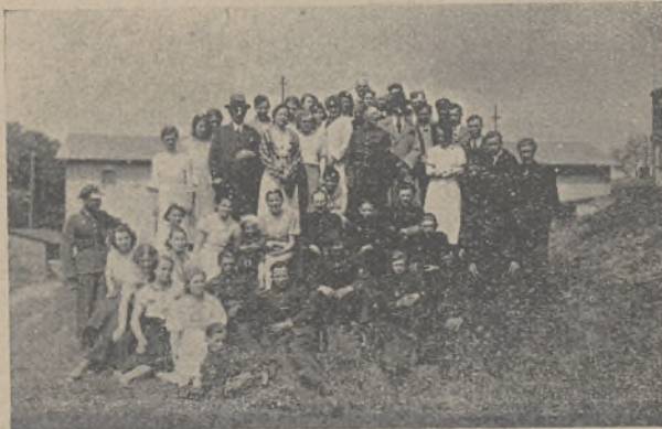
Uczestnicy wycieczki Z. S. Szubina do Wapienna.