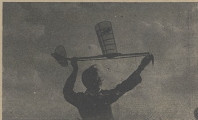
Start modelu z ręki.