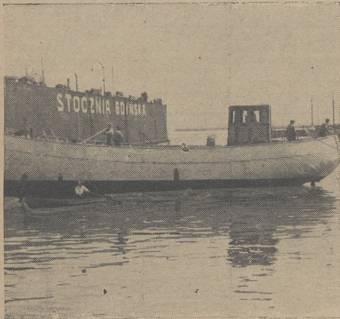
Kuter rybacki do połowów dalekomorskich, całkowicie wykonany w stoczni Morskiego Instytutu Rybackiego w Gdyni.

Pierwszy wzgląd wypływa nie tylko z kształtowania się koniunktury gospodarczej, stającej się coraz pomyślniejszą również w dziedzinie handlu zagranicznego, prowadzonego drogą morską, lecz także — i to przede wszystkim — wynika on z charakteru polskiej polityki handlu zagranicznego i kierunku, w którym ten handel już od szeregu lat obrał sobie drogę na zewnątrz, t. j. przez porty polskiego obszaru celnego (w 77% w r. 1936). Jeżeli do tego dodamy, że handel morski, który był i jest podstawą dobrobytu nie tylko jednostek, lecz i bogatych i potężnych krajów świata, znajduje się jeszcze w Polsce w stadium początkowego rozwoju jakościowego, i że, zgodnie z wielokrotnie wypowiedzianym z różnych stron aurytatywnych zdaniem, Polsce przypada obecnie, po wybudowaniu własnego portu i stworzeniu marynarki handlowej, zwrócić z kolei największe wysiłki na ten ogromnie ważny odcinek, to wyniknie z tego jasno, gdzie leży piękna przyszłość pracy i jej rezultatów dla młodego pokolenia.