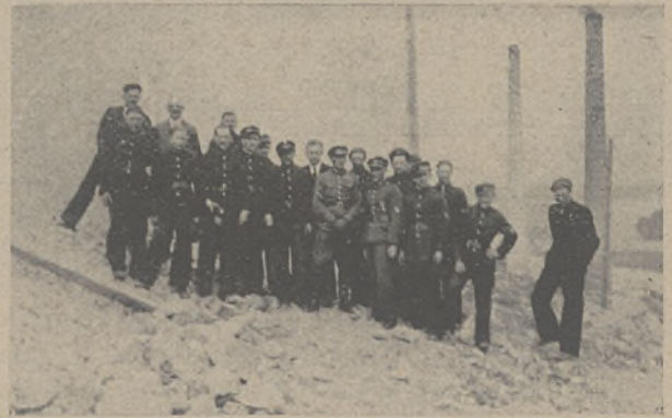
Członkowie Oddziału Z. S. Szubin na tle kominów Zakładów Wapiennych w Wapieniu.

Prosimy Szanownych ofiarodawców o podanie dalszych Obywateli, którym obrona Pomorza leży na sercu w myśl słów Wielkiego Marszałka „Każdy Obywatel żołnierzem, każdy żołnierz Obywatel”, celem podtrzymania łańcucha składkowego.