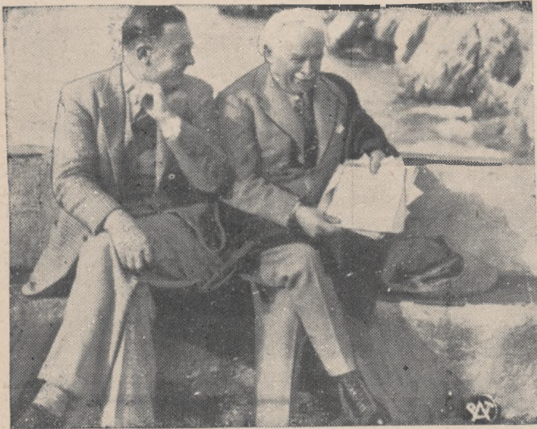
Lloyd George z synem.