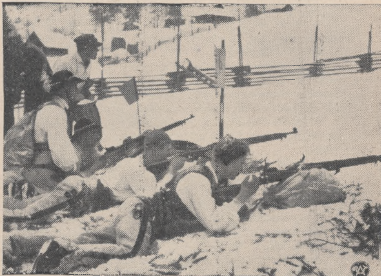
W Worochcie zakończył się tradycyjny marsz narciarski Szlaku II-ej Brygady Legionów. Ostatni etap marszu obejmował szlak Żabie — Worochta, na dystansie 30 km. I-szą nagrodę przechodnią im. Pierwszego Marszałka Piłsudskiego otrzymał zwycięski patrol I-ej klasy WKS. w Nowym Sączu. Na zdjęciu patrol góralski na strzelnicy w Worochcie.

fachowych dyskusjach, ustalono ostatecznie, że świetlica będzie na kolor radosny, jasny, czyli tak zwany groszkowy.