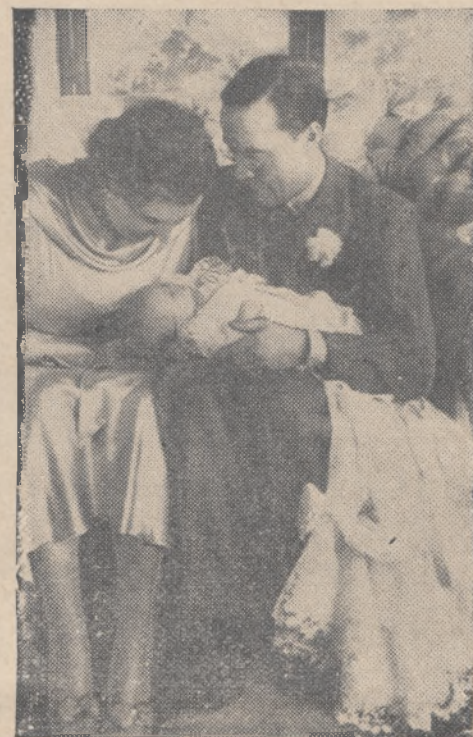
Po narodzinach na królewskim Dworze hollenderskim

— Małżonkowie odpowiadają solidarnie za zobowiązania,