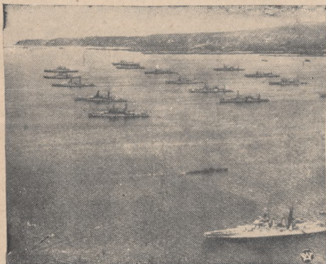
MANEWRY AMERYKAŃSKIE NA PACYFIKU

Ostatnio odbyły się na Pacyfiku wielkie manewry amerykańskiej floty wojennej, w których uczestniczyło przeszło 100 bojowych jednostek morskich.